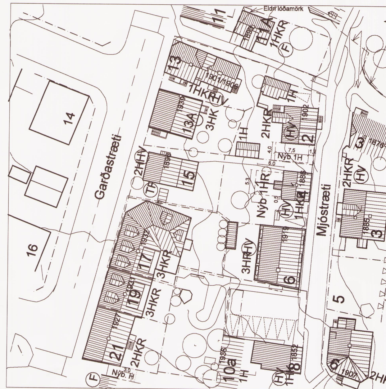
Grjótaþorp 1.136.5 Hluti deiliskipulags, deiliskipulagsbreyting 2014