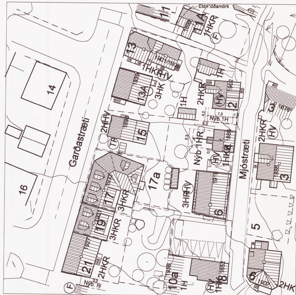
Grjótaþorp 1.136.5 Hluti deiliskipulags, sbr. samþykkt borgarráðs 30. júlí 2002