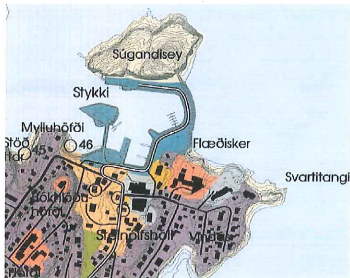
Aðalskipulag Stykkishólms 2002-2022

Breyting á aðalskipulagi vegna lóðarinnar Austurgata 7