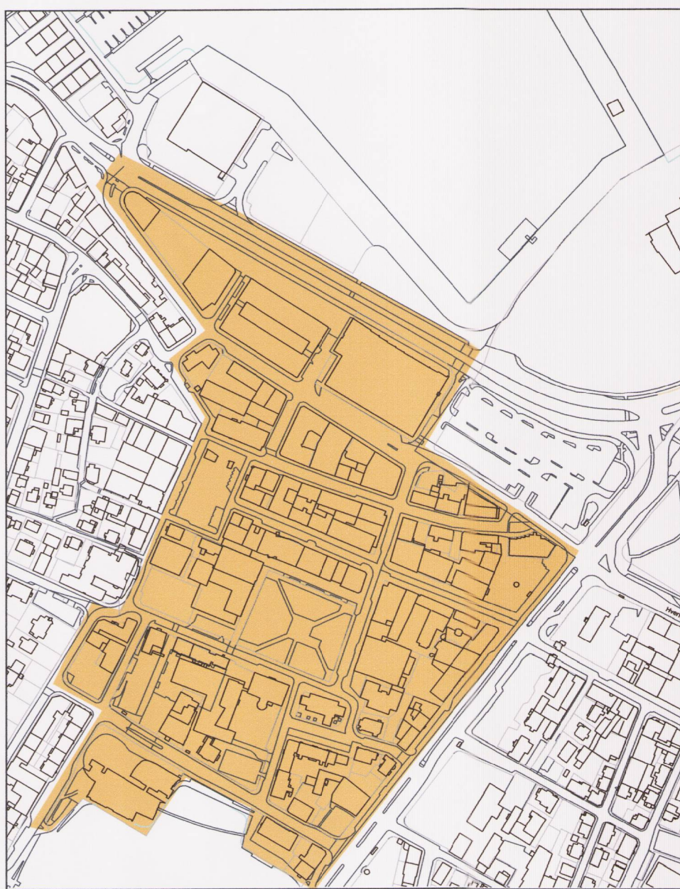
Skýringarmynd: Núverandi afmörkun deiliskipulags Kvosarinnar. Mkv. 1:4000

Á deiliskipulagssvæðinu eins og það er afmarkað á uppdrætti þessum, er heimilt að vera með þá starfsemi sem samræmist landnotkun gildandi aðalskipulags á hverjum tíma með þeim takmörkunum þó að hlutfall gistipjónustu, sbr. lög um veitingastaði, gististaði og skemmtanahald nr. 85/2007, verði ekki yfir 23% af samtölu birtrar stærðar eigna á skilgreindu svæði, sem nær yfir deiliskipulagssvæði Kvosarinnar í heild og hluta af deiliskipulagssvæðis Grjótaþorps, sbr. samhljóða breytingu á því deiliskipulagi. Við skilgreindar götuhliðar í M1a skal öll starfsemi á jarðhæðum vera opin og aðgengileg almenningi allan daginn og ekki er heimilt að hylja glugga.