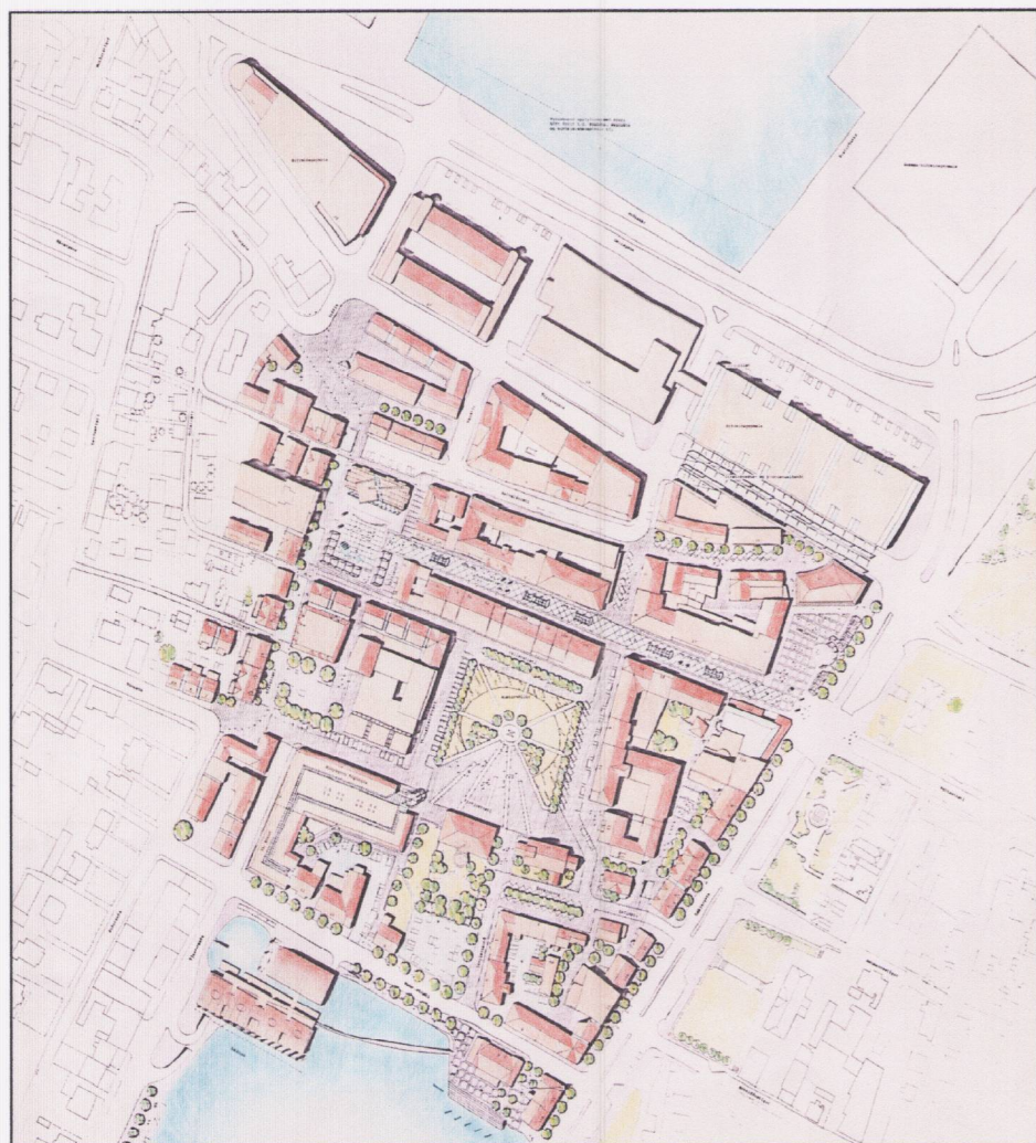
Deiliskipulag Kvosarinnar, eins og það var samþykkt 01.10.1987. Mkv. 1:4000