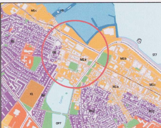
AÐALSKIPULAG REYKJAVÍKUR 2010-2030 YFIRLITSMYND