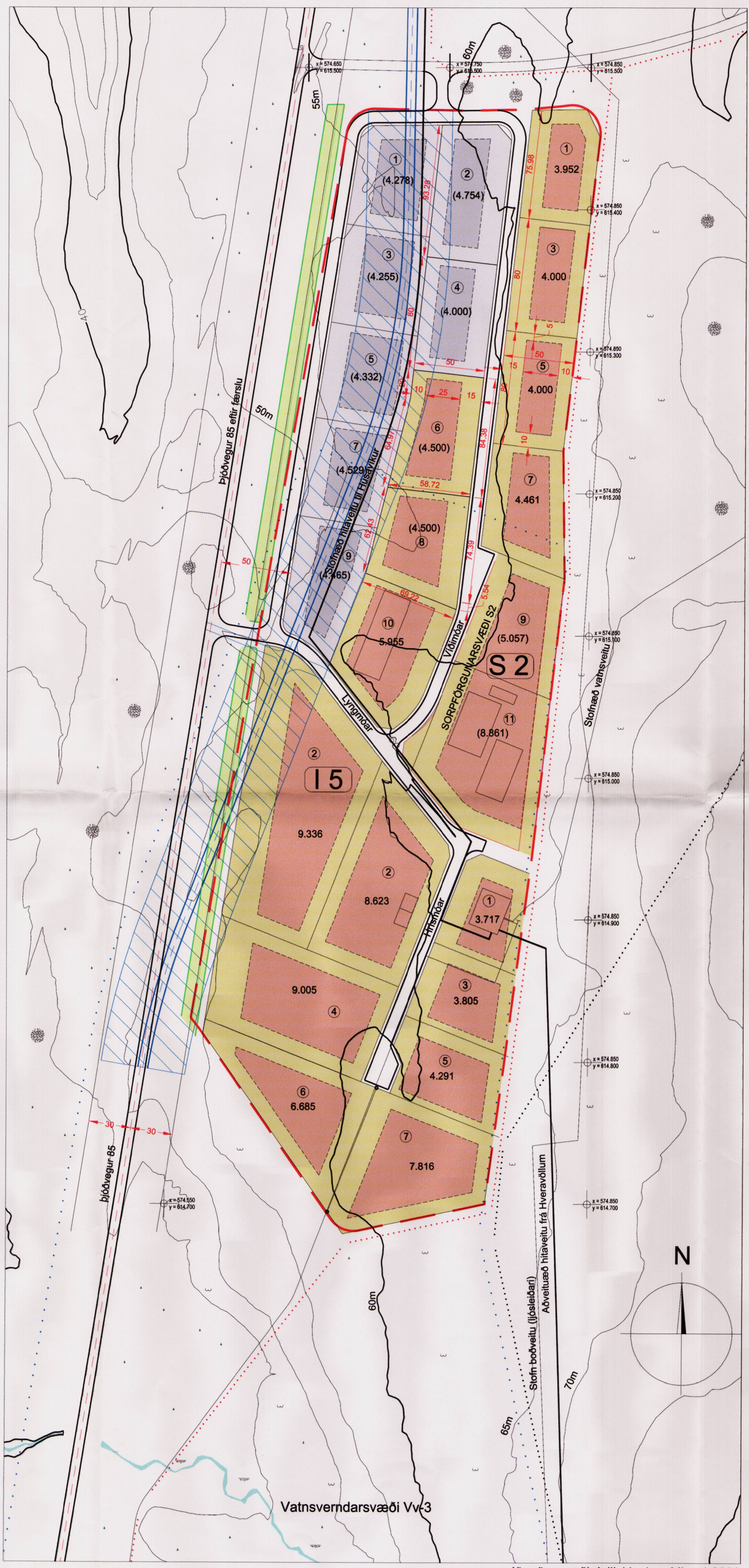
Iðnaðarsvæði deiliskipulag Mkv. 1:2000