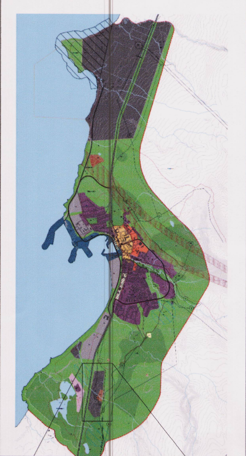
ADALSKIPULAG NORÐURÞINGS 2010-2030, ÞÉTTBYLISSVÆÐI HÚSAVIKUR STAÐFEST AF UMHVERFISRÁÐHERRA Í DESEMBER 2010