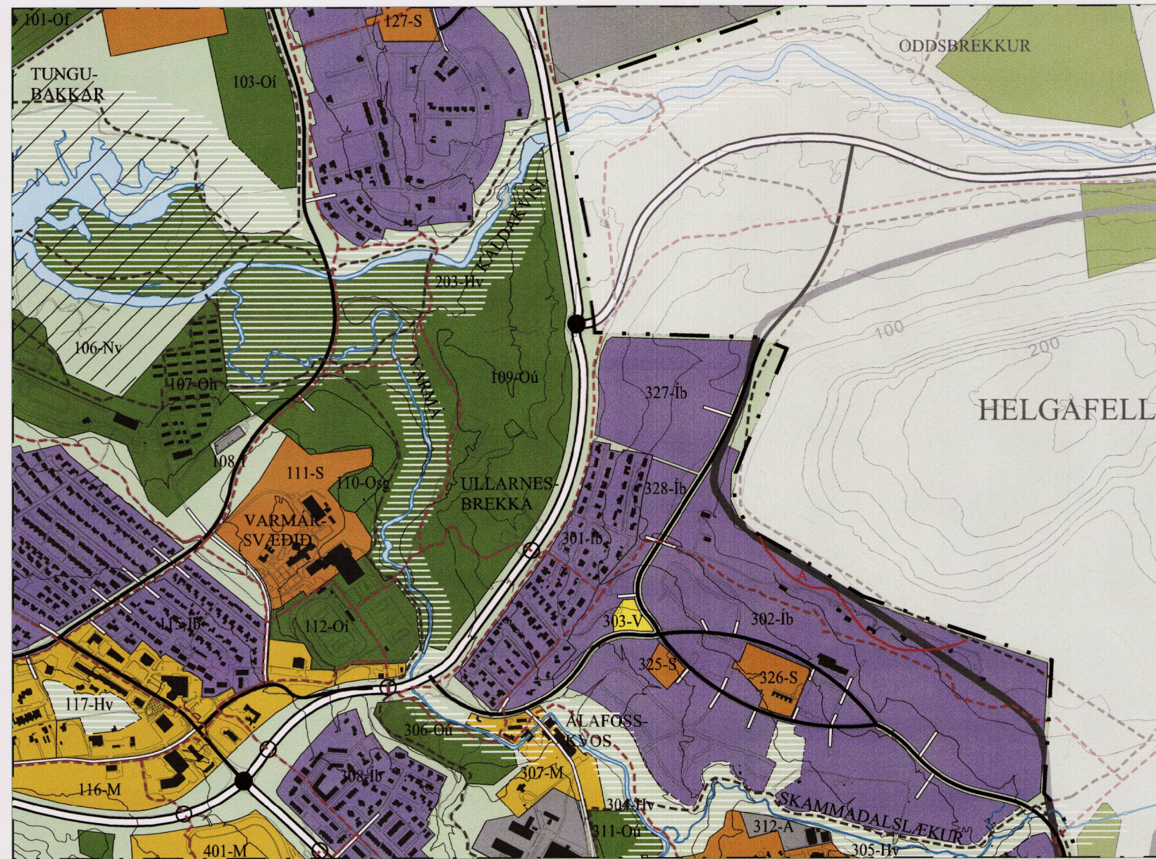
STAÐFEST AÐALSKIPULAG - ÞÉTTBÝLISUPPDRÁTTUR (HLUTI) MKV. 1:15.000 STAÐFEST 19.09.2013