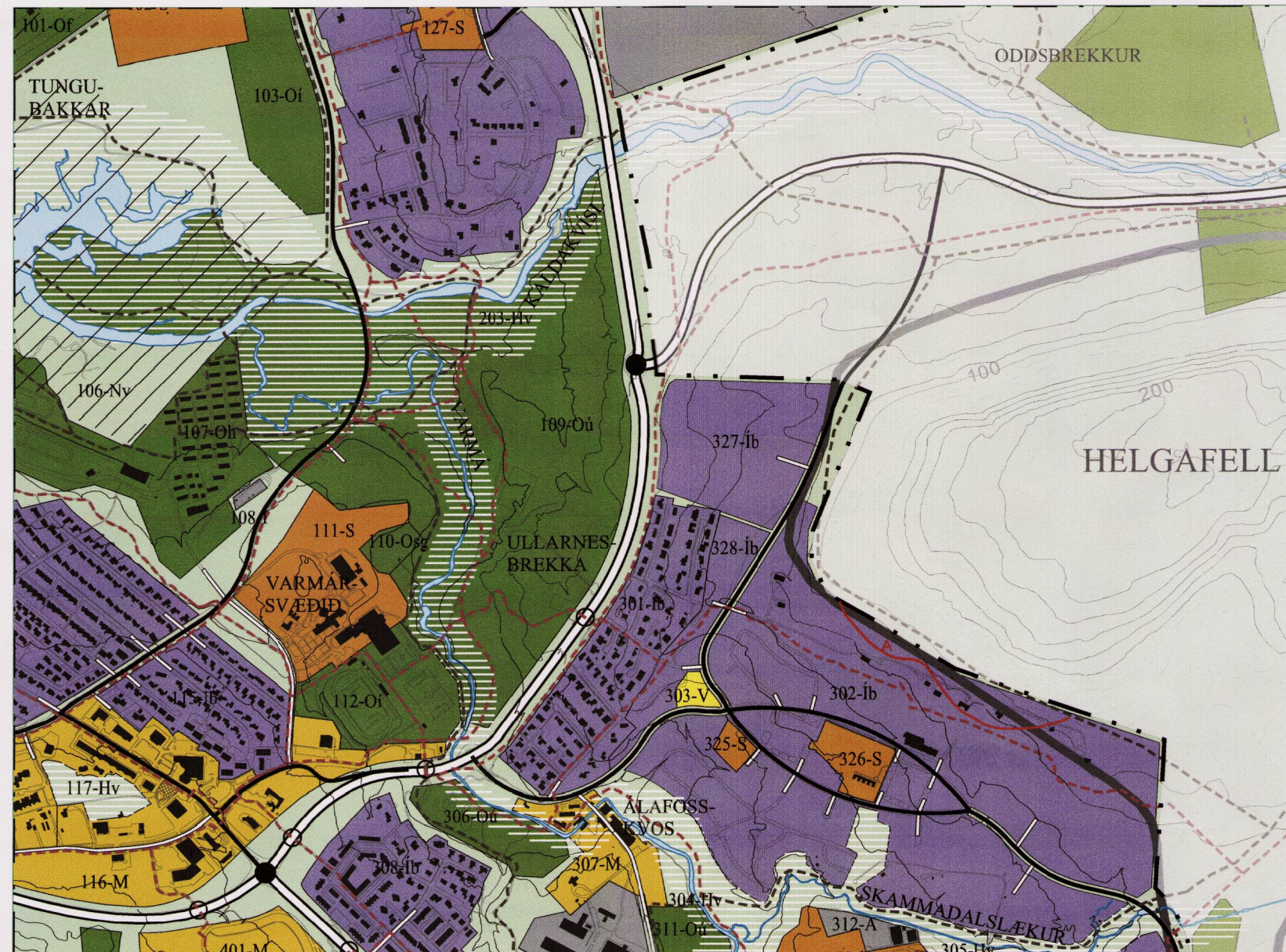
TILLAGA AÐ BREYTINGU - ÞÉTTBÝLISUPPDRÁTTUR (HLUTI) MKV. 1:15.000