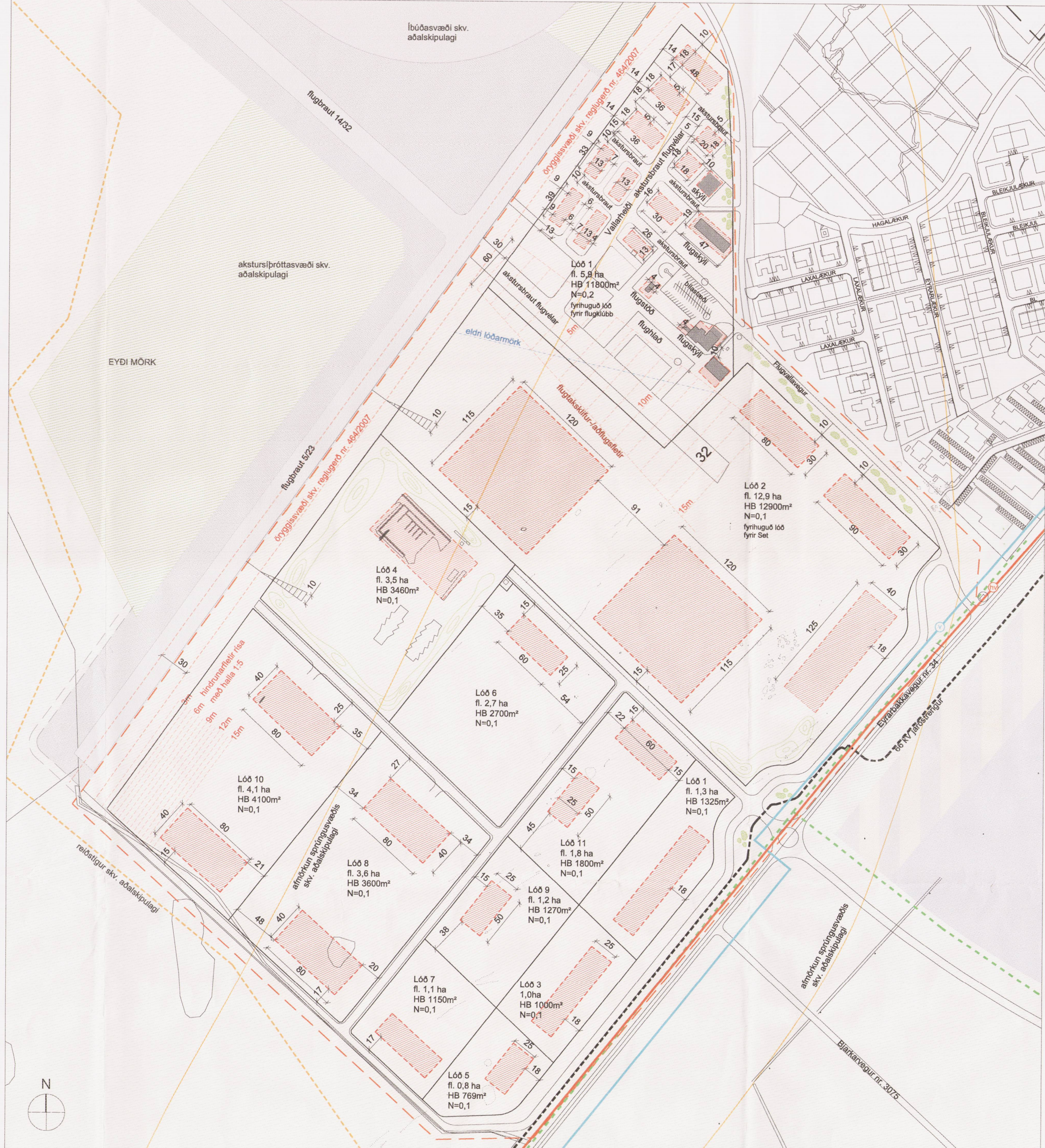
BREYTING Á DEILISKIPULAGI 1:3000