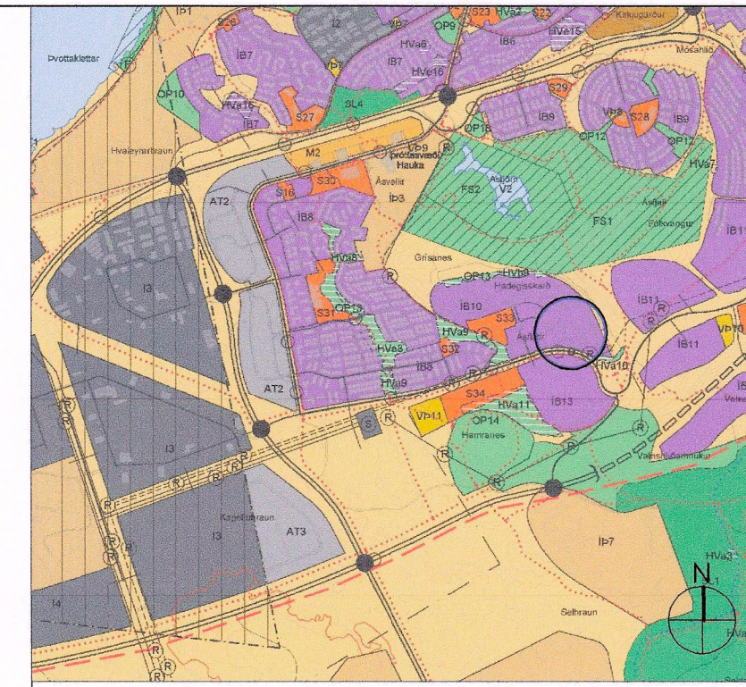
YFIRLIT - HLUTI ADALSKIPULAGS HAFNARFJARÐAR 2013 - 2025

Að öðru leyti gildir greinagerð deiliskipulags Skarðshlíðar 3. áfangi dags: 13. 03. 2019 útgáfa 07