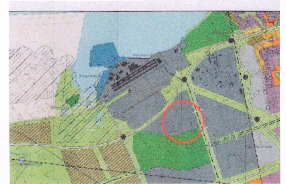
ADALSKIPULAG HAFNARFJÖRÐAR 2005 - 2025

Breytt deiliskipulag lóðar við Koparhella 1. Í breytingunni felst að: breyttur byggingarreitur. Nýtingarhlutfall er óbreytt. Að öðru leiti gilda greinagerð og skipulagsskilmálar, útg. 0.1 dags. 20. nóv. 2007.