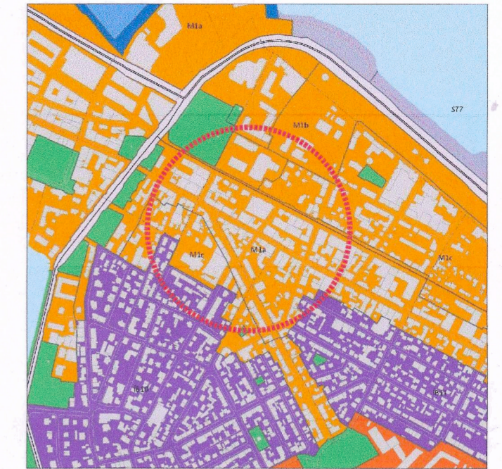
HLUTI GILDANDI ADALSKIPULAGS 2010-2030