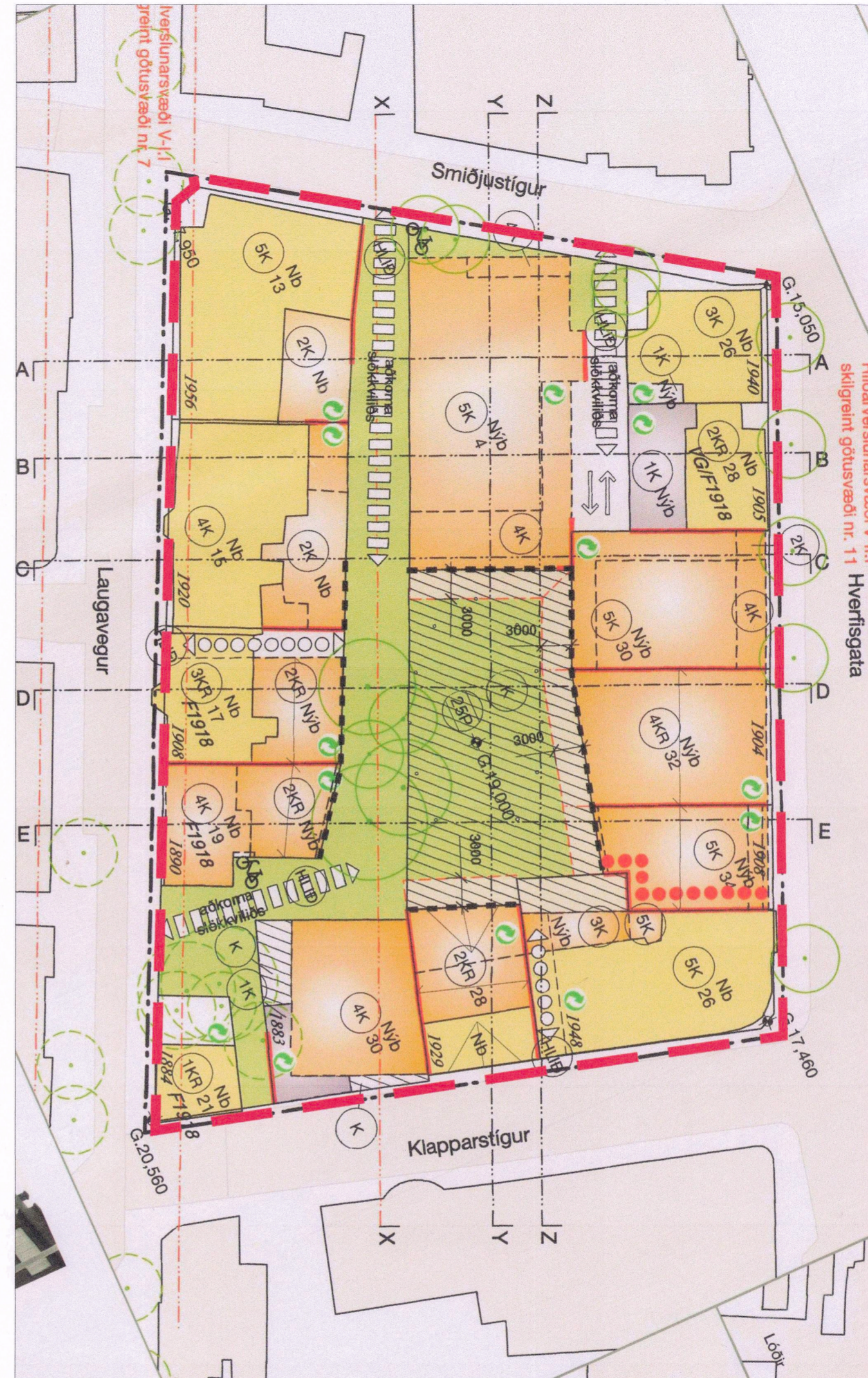
TILLAGA AÐ BREYTTUM DEILISKIPULAGSMÖRKUM

Í gildi er deiliskipulag staðgr. 1.171.1, Hljómalindareitur, dags. 13.04.2004, síðast breytt 10.11.2017 sem þarf að breyta svo að ekki verði skörun á skipulagsmörkun á milli skipulagssvæða vegna nýs deiliskipulags fyrir hluta Laugvegur vegna göngugötu. Breytingin felst eingöngu í því að mörkum deiliskipulagsins er breytt á þann hátt að í stað þess að mörkin liggja í miðri götu eru þau færð inn að lóðarmörkum við Laugaveg og Klapparstíg.