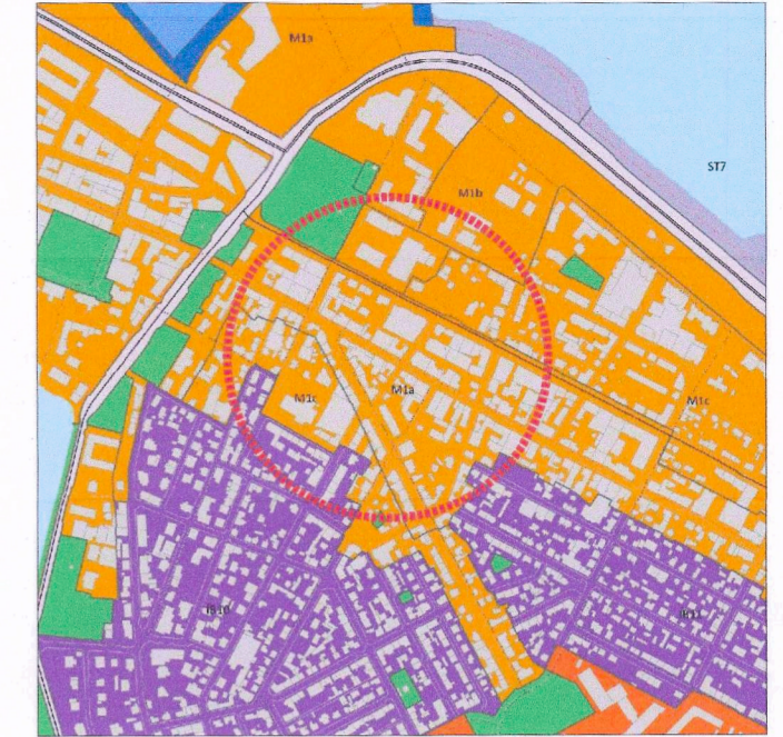
HLUTI GILDANDI AÐALSCHIPULAGS 2010-2030