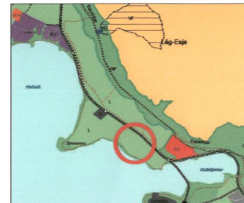
Hluti gildandi aðalskipulags Reykjavíkur 2010-2030, samþykkt 24.02.2014

Deiliskipulagsbreyting þessi sem fengið hefur meðferð í samræmi við ákvæði 1.mgr. 43. gr.