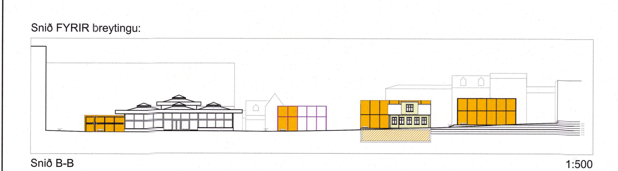
Sníð B-B 1:500