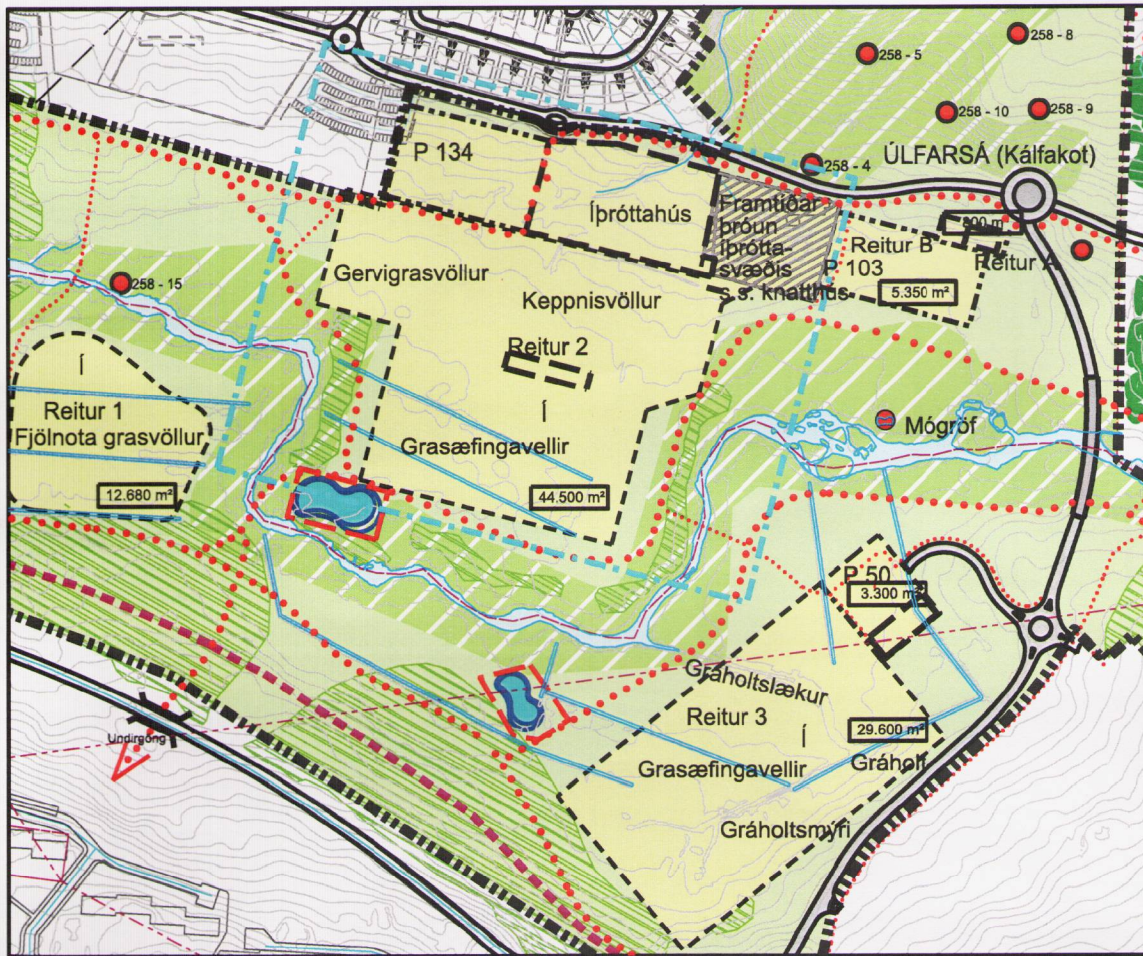
Gildandi deiliskipulag samþykkt í borgarráði október 2008, mkv. 1:5000