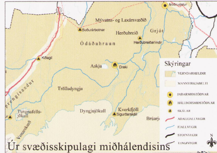
Úr svæðisskipulagi miðhálandisins