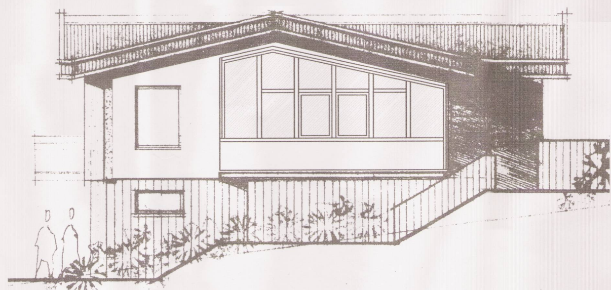
SKÝRINGARTEIKNING, ÚTLIT TIL VESTURS. 1:100

ANNAD SKAL VERA Í SAMRÆMI VID GILDANDI SKILMÁLA.