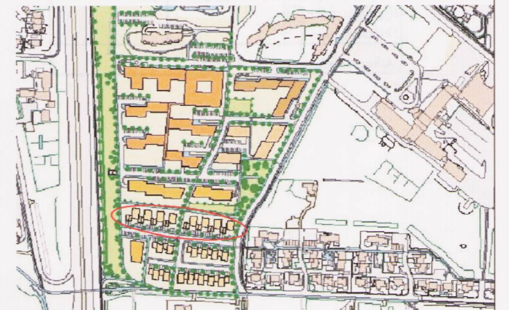
STAÐSETNING REITS 1.794...