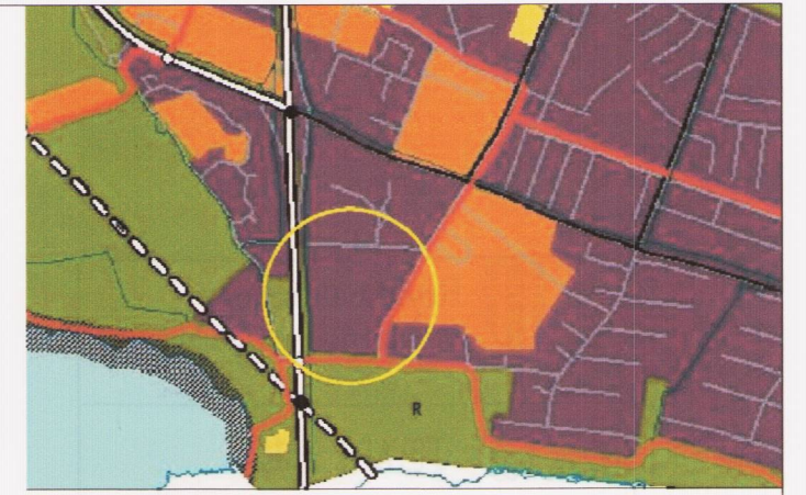
YFIRLITSBLAÐ ÚR ADALSKIPULAGI

Lóðirnar eru ætlaðar undir sérhæðir. Á hverri lóð er heimilt að byggja hús á þremur hæðum með kjallara undir grunnfleti íbúðar. Í hverju húsi mega vera 2-3 íbúðir. Séríngangur skal vera í hverja íbúð og skal bílskúr og 2 bílastæði fylgja hvorri íbúð. Ef íbúðirnar verða þrjár þá er eitt stæði á hverja íbúð en fjórða stæðið sameiginlegt. Staðsetning bílastæða er bindandi, ekki er heimilt að gera fleiri bílastæði á lóðinni. Byggingarlína bílskúra við götu er bundin og húsa að hluta. Hámarksstærðir sbr. skýringamynd og töflu. Í kjallara er óheimilt að gera íbúðarrými, þar skulu vera rými s.s. geymslur og þvottahús. Á húshliðum sem snúa ekki að götu er heimilt að grafa frá kjallara og gera kjallaratröppur, einnig er heimilt að gera kjallaraglugga í a.m.k. 1,6 m hæð frá gólfi. Vegg- og þakhæðir sbr. skýringamyndir. Heimilt er að gera þakgarð ofan á bílskúrsþaki. Æskilegt er að a.m.k. einu myndarlegu lauftré verði plantað næst götu (sbr. skýringarmynd), s.s. reyni, gullregni, álmi, hlyni, hegg, elri eða eli. Ef til þess kemur er leyfilegt er að lyftustokkur fari hámark 1m. upp úr þaki.