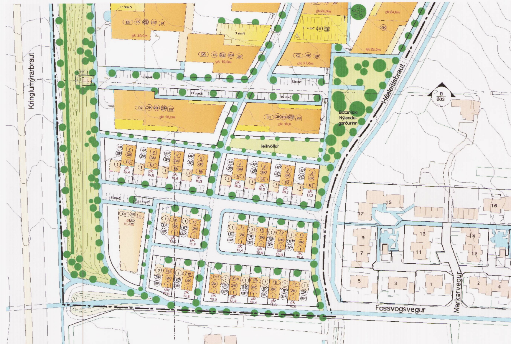
Gildandi deiliskipulag samþykkt í Borgarráði 12.07.2007 - og B-deild Stjórnatíðinda 12. sept. 07 mkv. 1:1000