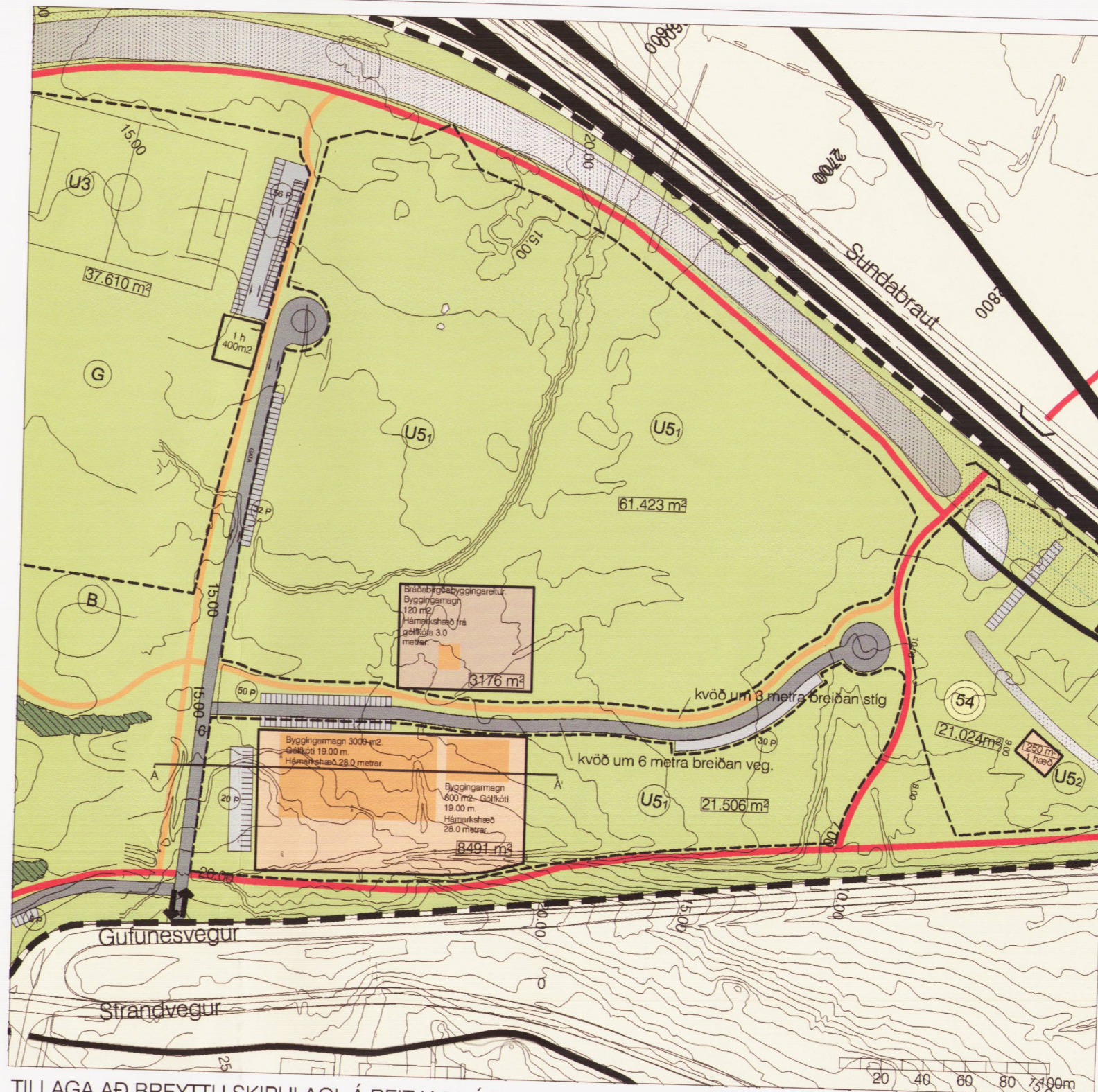
TILLAGA AÐ BREYTTU SKIPULAGI Á REIT U 51 Í GUFUNESI MKV 1 : 2500