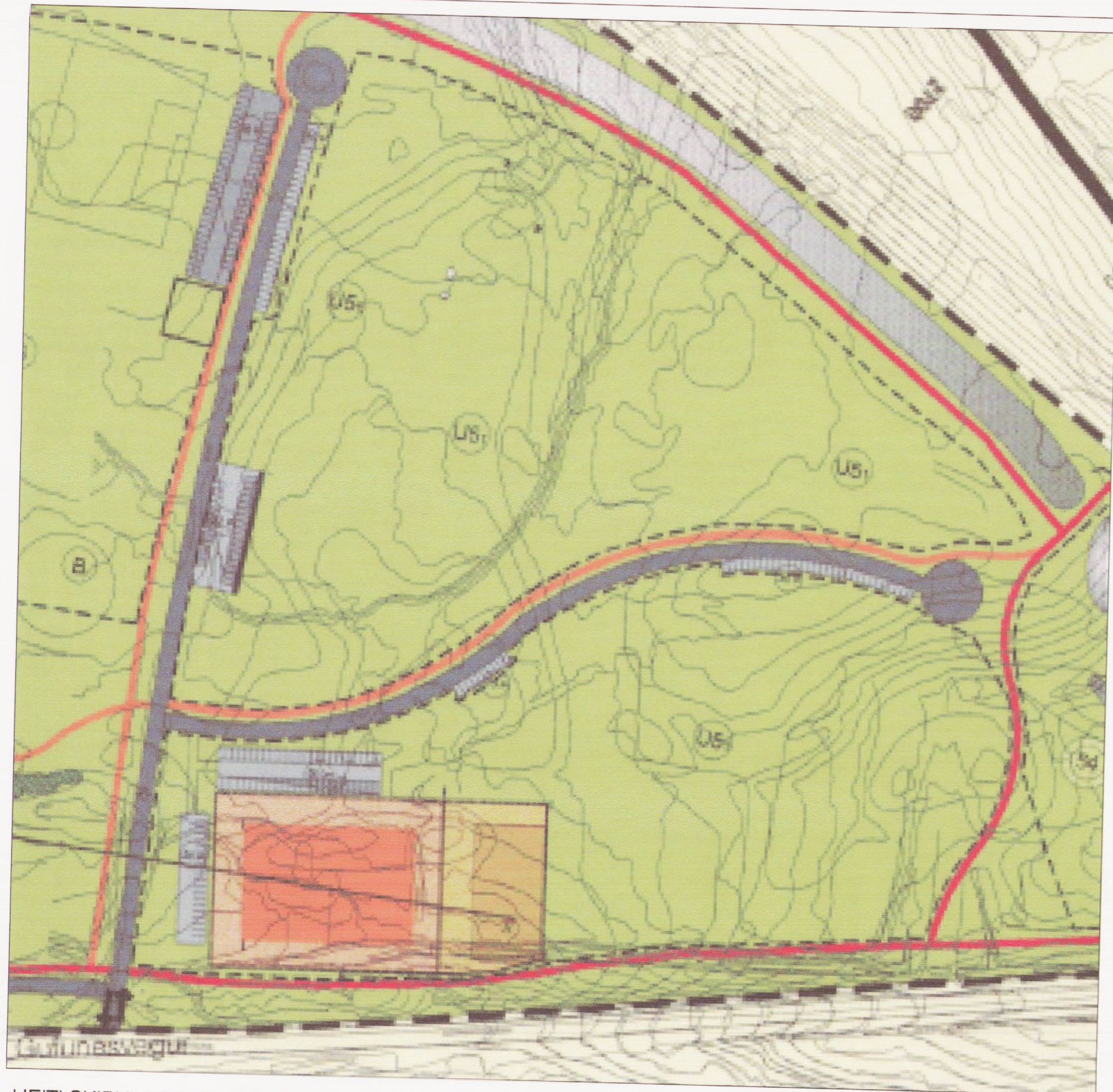
HEITI SKIPULAGS: GUFUNES, mkv upp. 1:2500 HLUTI AF GILDANDI SKIPULAG SAMÞYKKT Í BORGARÁÐI 20.05.2010.