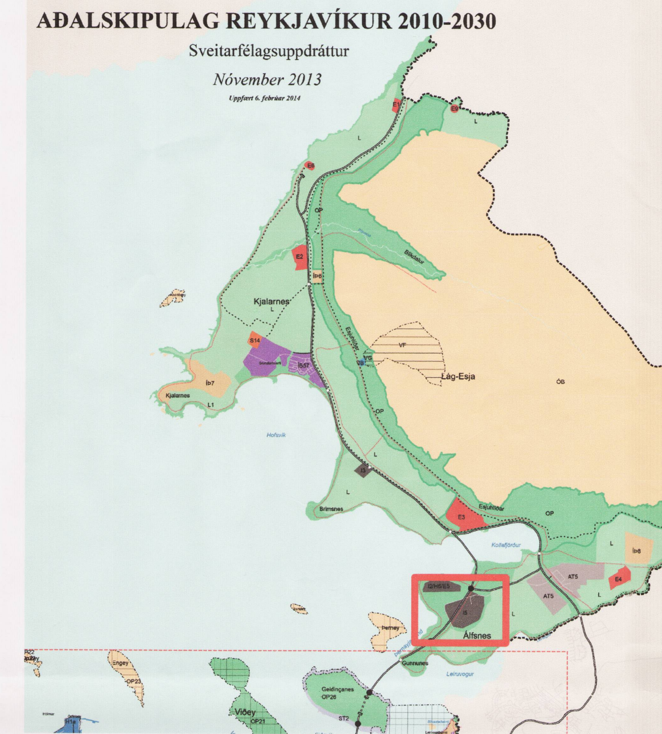
Úrklippa af sveitarfélagsuppdrætti Aðalskipulags Reykjavíkur 2010 - 2030 Deiliskipulagssvæðið er innan rauða feringins