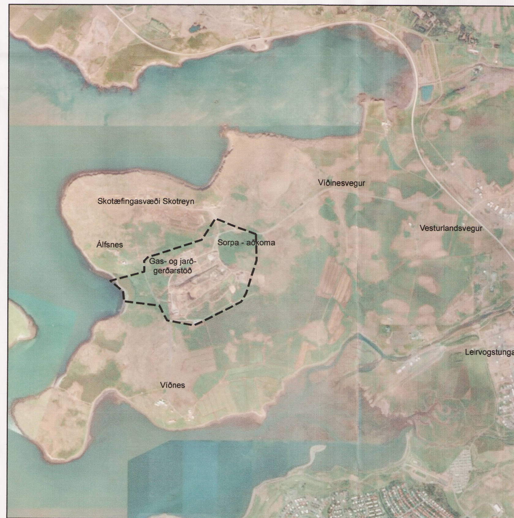
Yfirlitsmynd. Mkv. 1:20.000