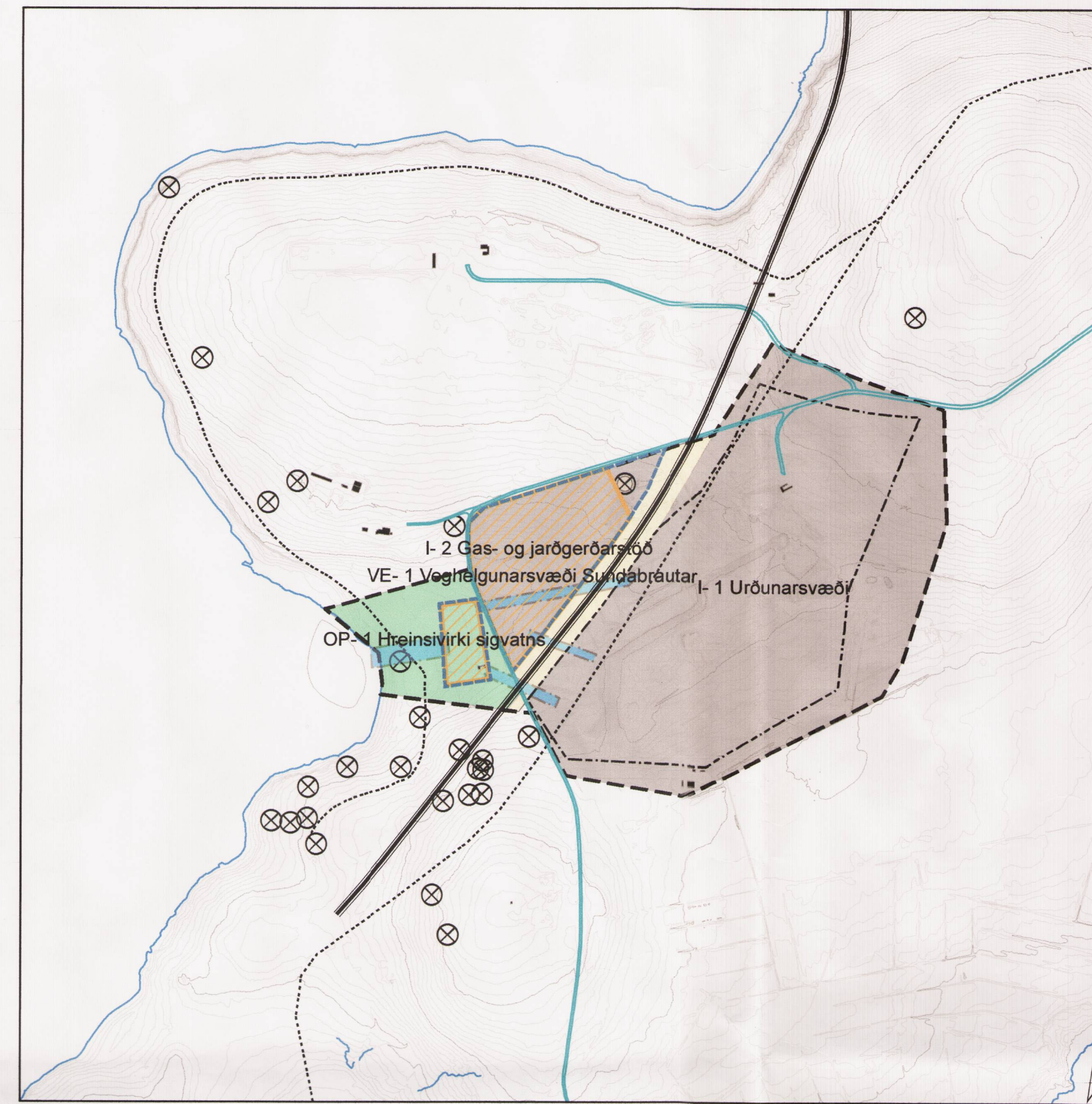
Tillaga að breytingu. Mkv. 1:10.000