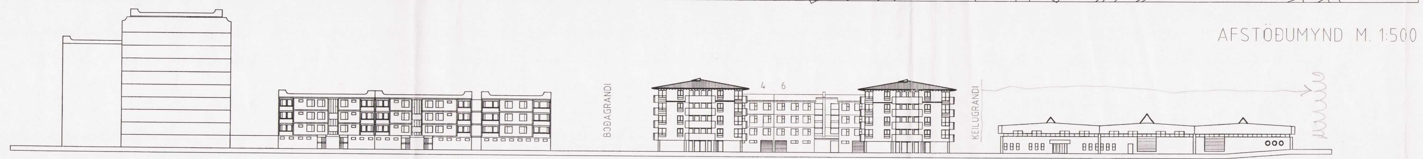
AFSTÖÐUMYND M. 1:500

Á LÖÐinni ERU 2 STÆÐI Á ÍBÚÐ EÐA ALLS 56 STÆÐI. 25 STÆÐI ERU Í BÍLGEYMSLU, 8 STÆÐI ERU UNDIR ÞAKI Á 1 HÆÐ OG 23 STÆÐI ERU Á OPNU SVÆÐI.