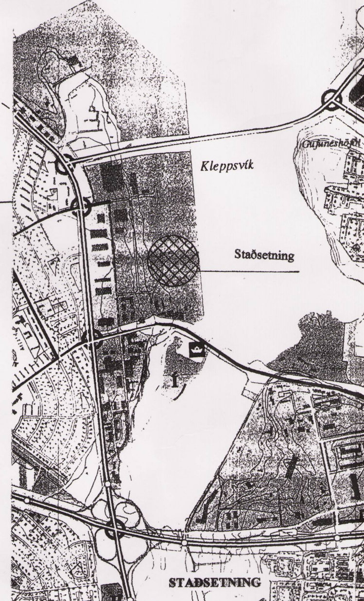
Deiliskipulag í Kleppsvík. Almennir skipulagskilmálar.