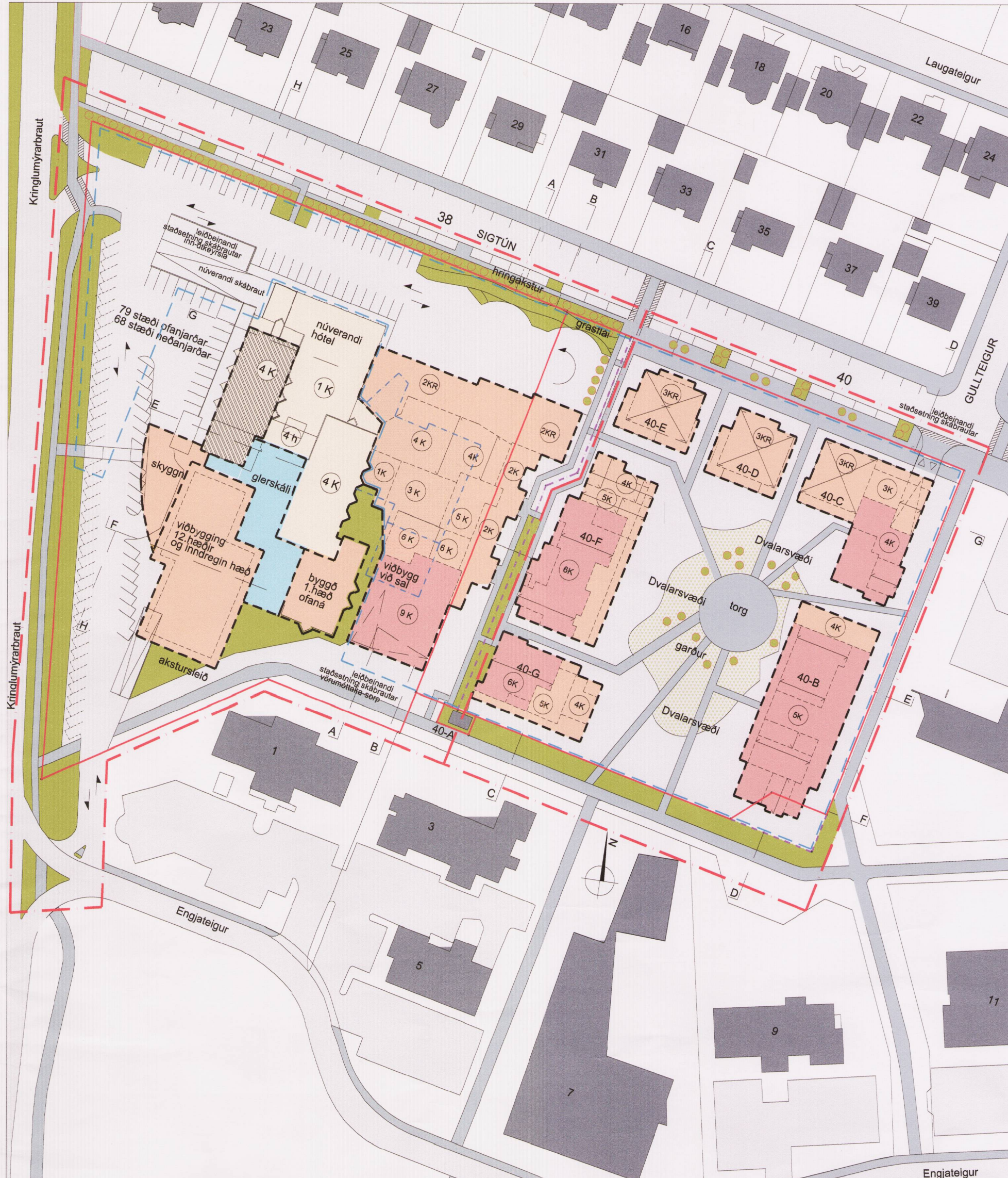
TILLAGA AÐ BREYTTU DEILISKIPULAGI SIGTÚN 38-40 mkv.1.1000