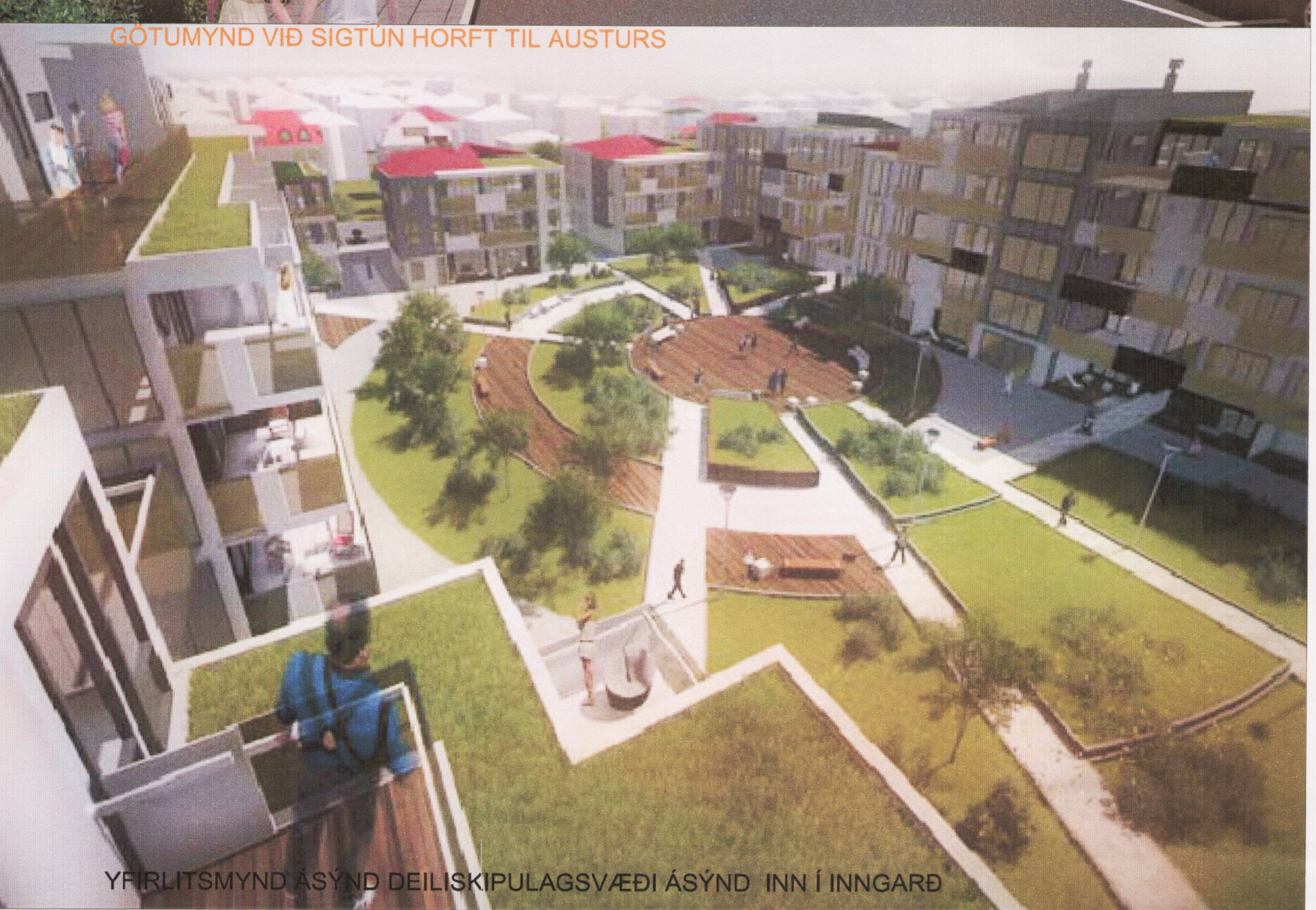
YFIRLITSMYND ASYND DEILISKIPULAGSVÆÐI ASYND INN Í INNGARÐ