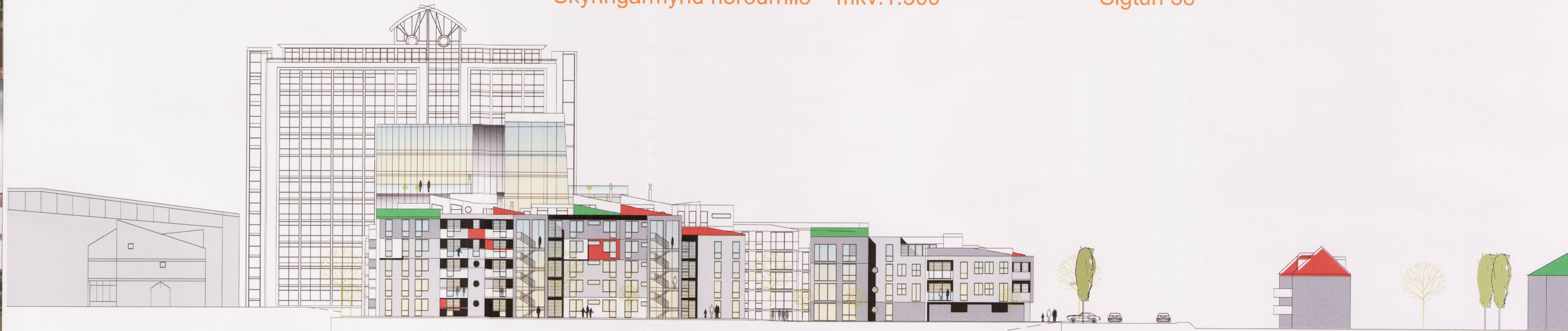
Skýringarmynd útlit reitur 40B,C austurlið mkv.1.500