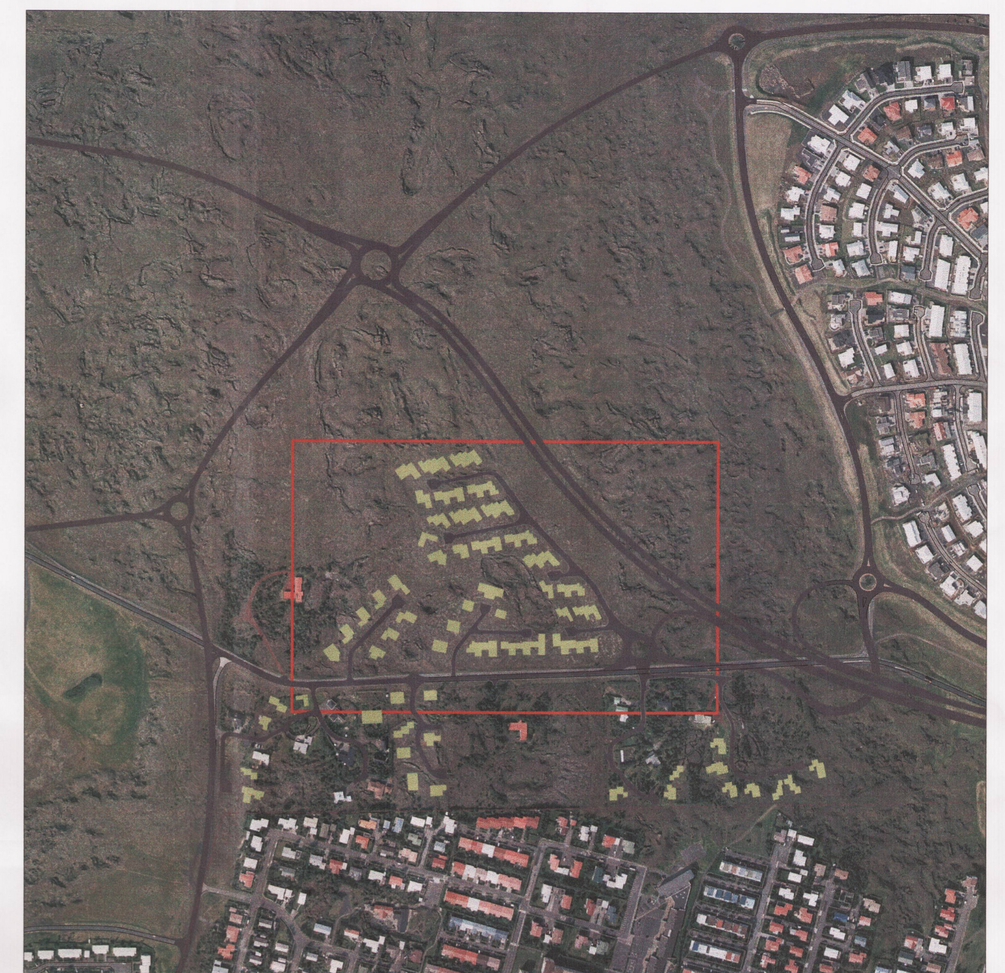
Skýringarmynd fyrir breytingu 1:5000