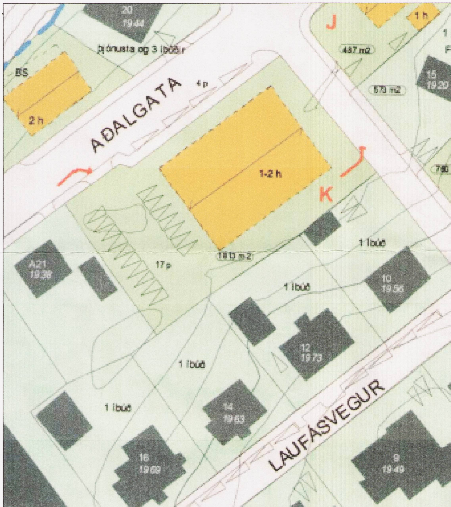
GILDANDI DEILISKIPULAG FRÁ 29.01.2009. MKV: 1:500

Hluti af gildandi deiliskipulag Stykkishólmur miðbær var samþykkt 28.08.2003, með síðari breytingum 26.05.2005, mkv 1:1000, 29.11.2007 mkv. 1:1000 og 29.01.2009, mkv 1:1000