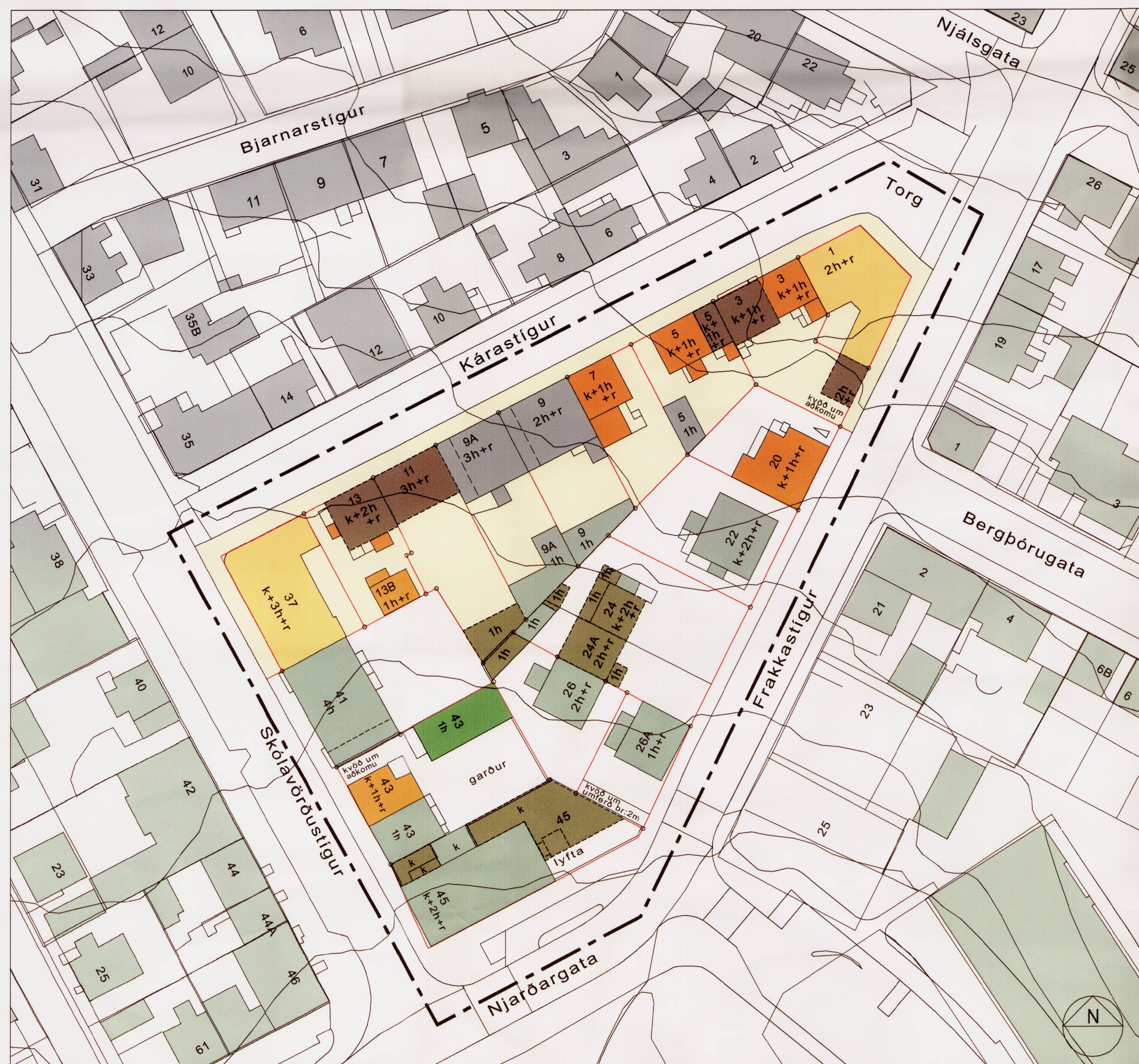
GILDANDI DEILISKIPULAG, SAMÞYKKT 4. SEPTEMBER 2008 OG BIRTIST Í B-DEILD 2. DESEMBER 2008