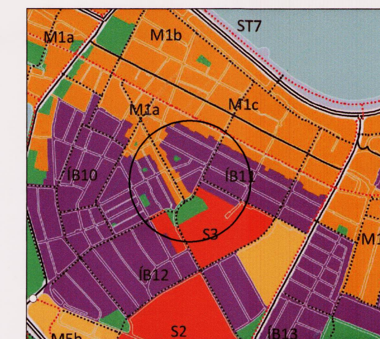
HLUTI AÐALSKIPULAGS REYKJAVÍKUR 2010-30