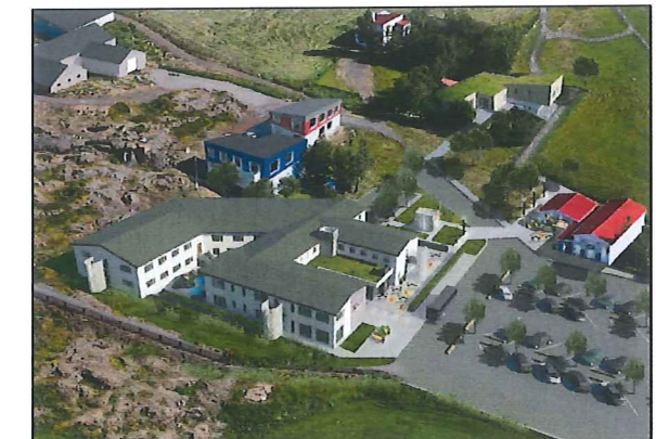
Loftmynd af nýju skipulagi