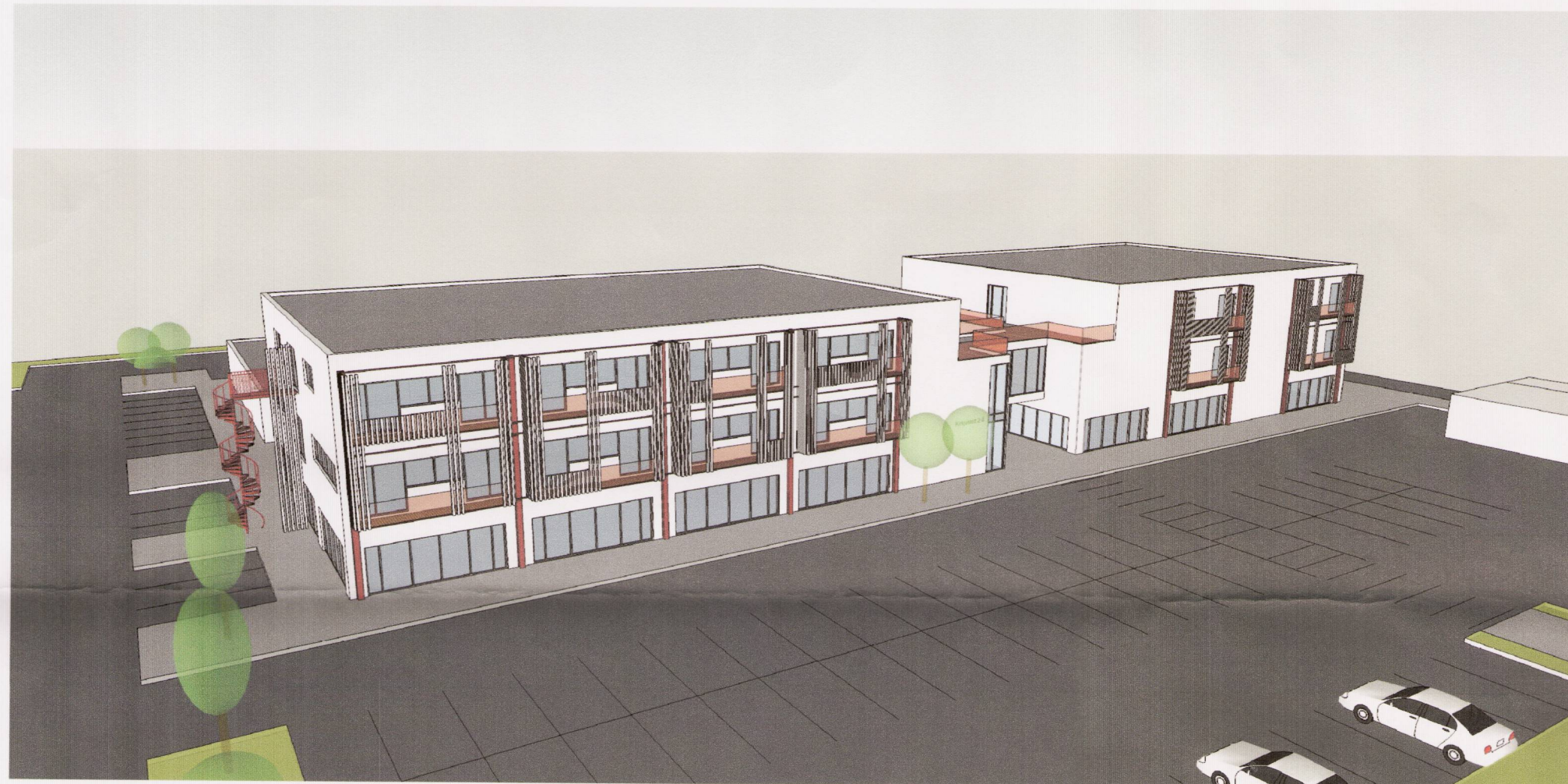
Séð frá norðaustur