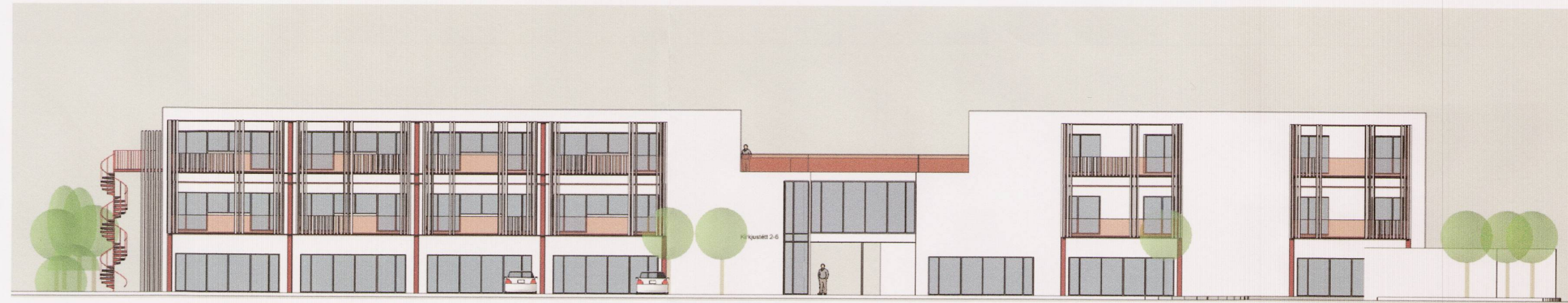
Ásýnd séð frá Kristnibraut/Kirkjustétt