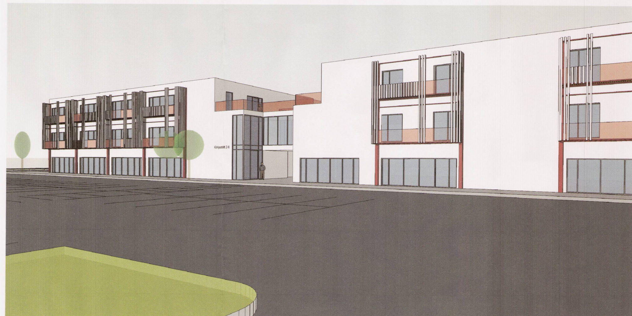
Séð frá norðvestur