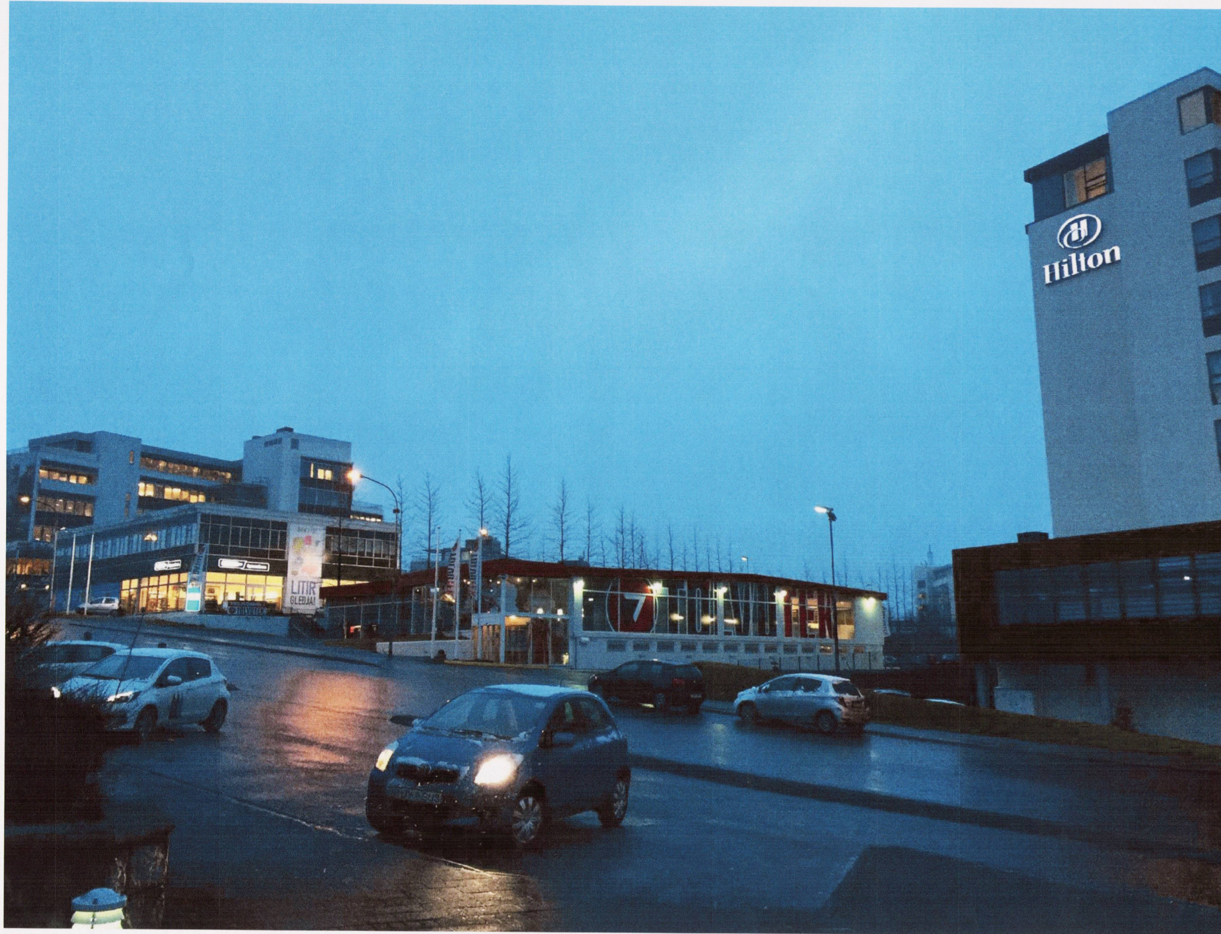
Ásýnd frá Hallarmúla