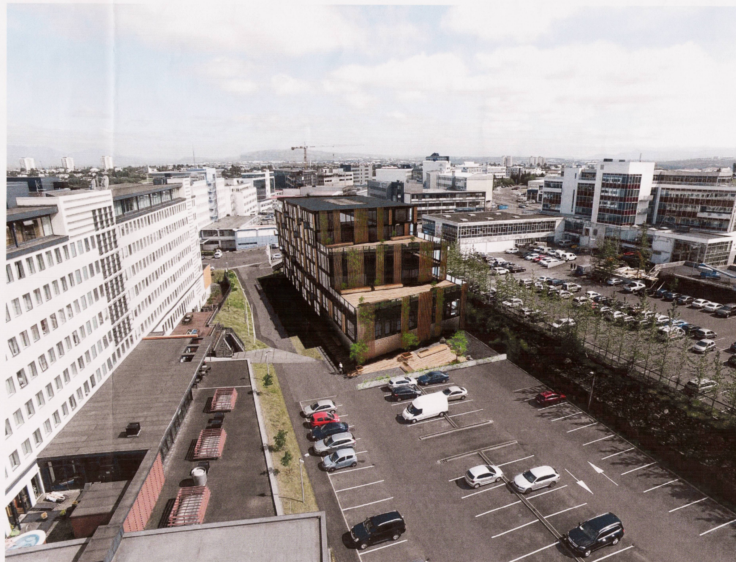
Ásýnd úr áttinni Lág múla