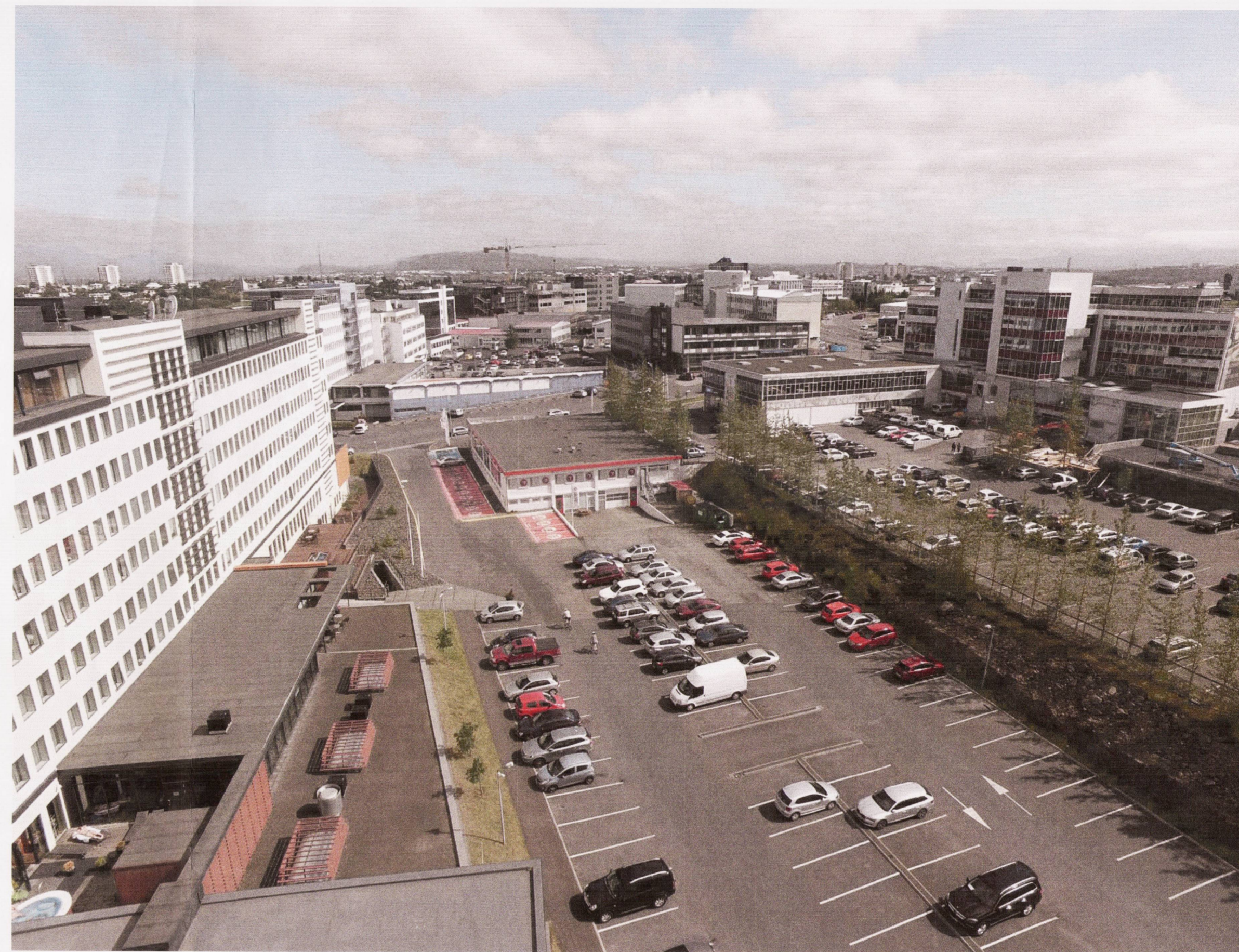
Ásýnd úr áttinni Lág múla