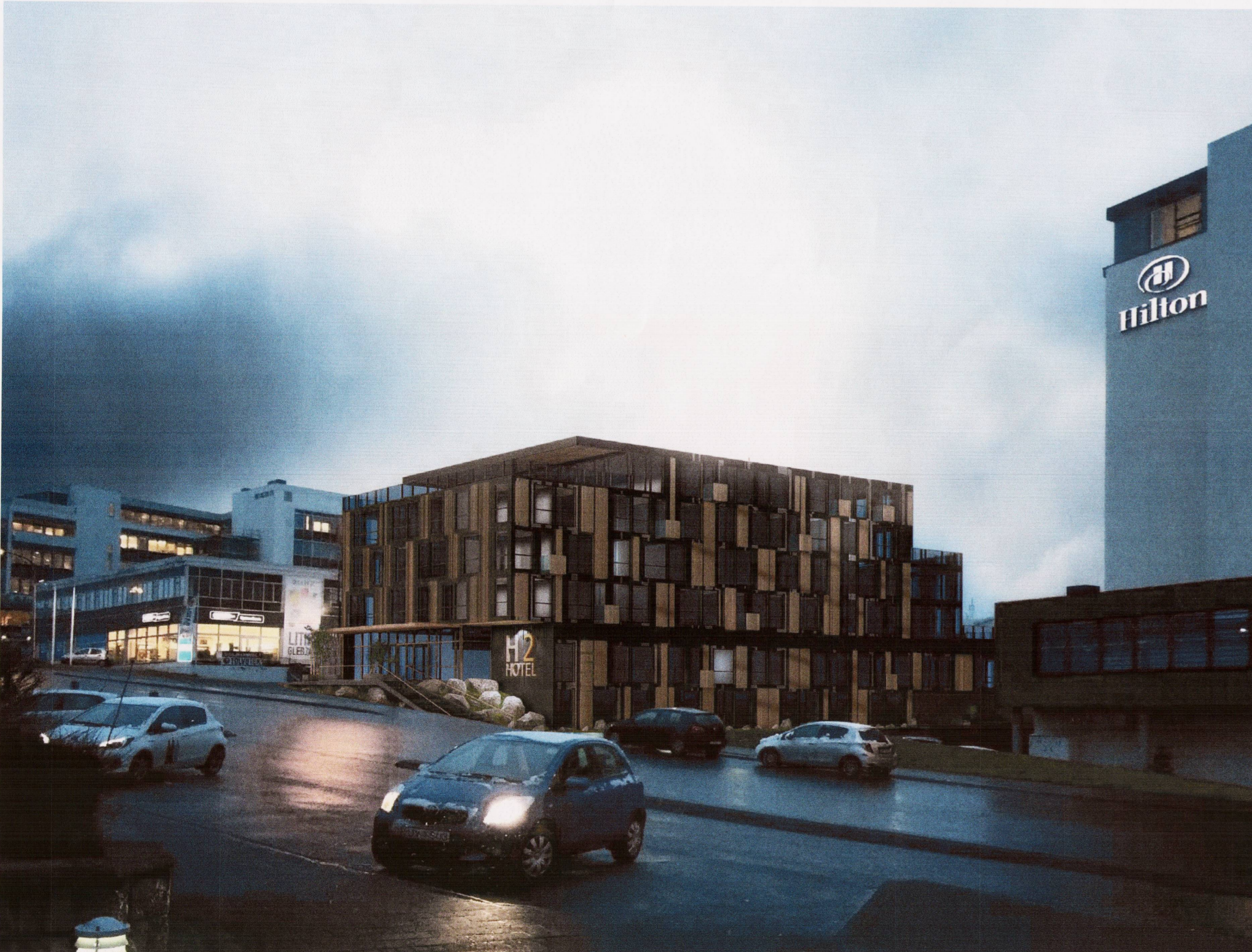
Ásýnd frá Hallarmúla