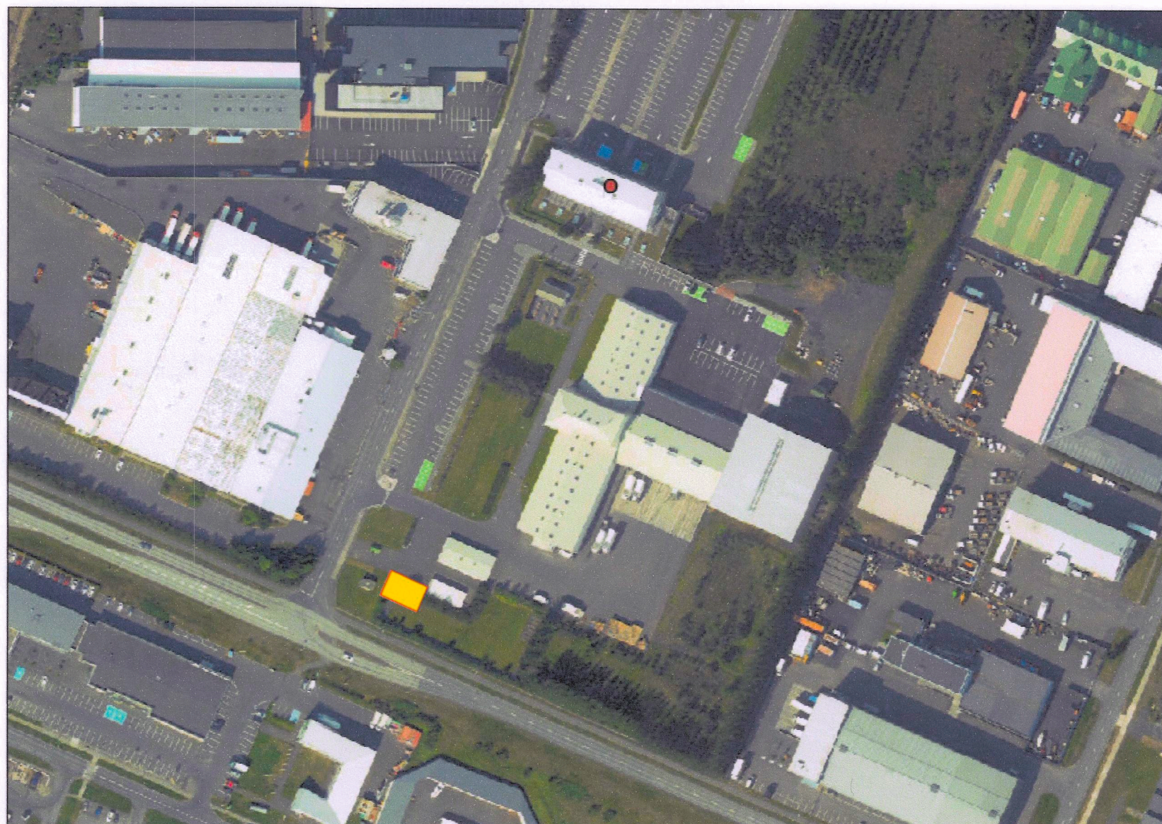
Loftmynd til skýringar með viðbótar byggingarreiti