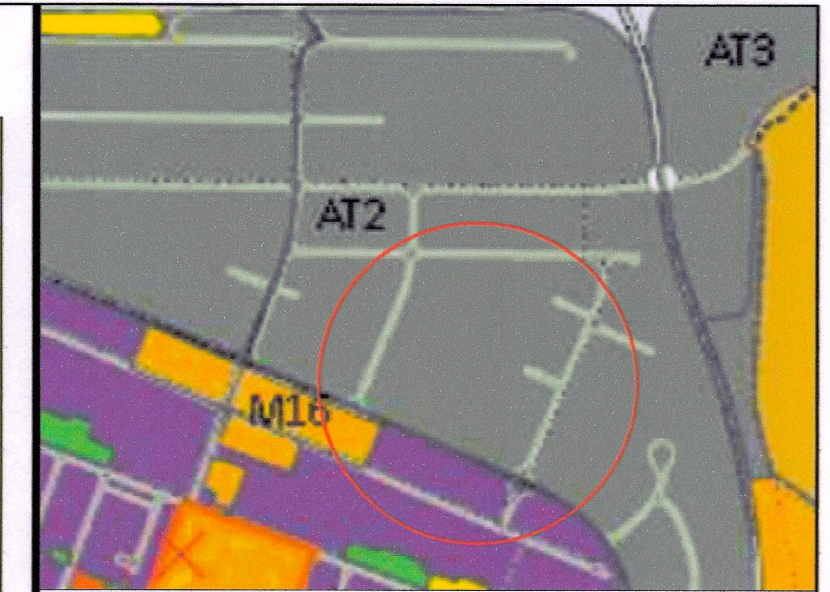
Hluti Aðalskipulags Reykjavíkur 2010-2030 Staðsetning svæðisins

Stærð þess yrði að hámarki 150 m 2 og þakhæð yrði að hámarki 5,3 m.