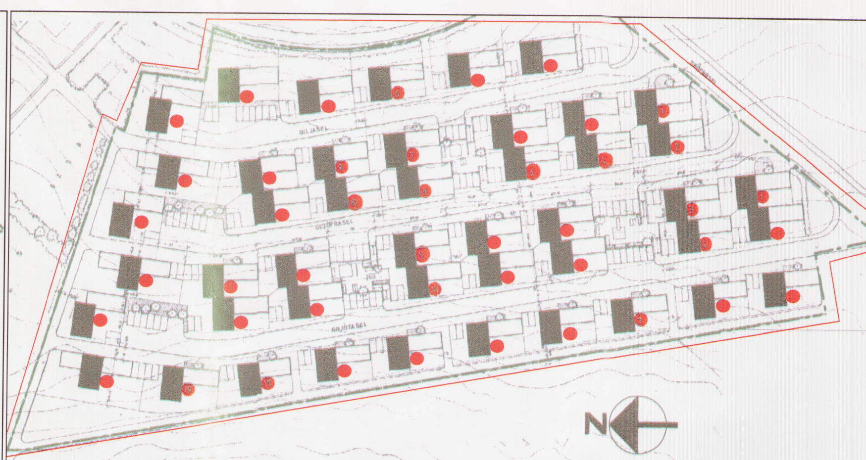
Tillaga að breyttu deiliskipulagi Mkv.1:1000