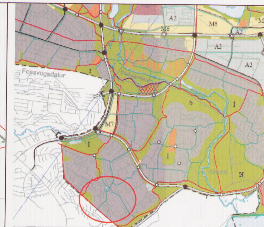
Hluti Aðalskipulags Reykjavíkur 2001-2024 staðsetning svæðis.