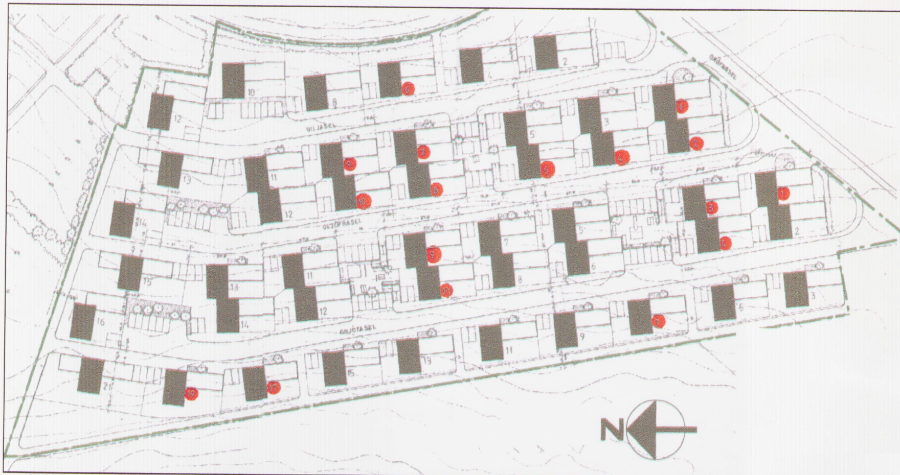
Gildandi deiliskipulag "Seljahverfi" samþykkt í Borgaráði þann 30.01. 2001. Mkv.1:1000