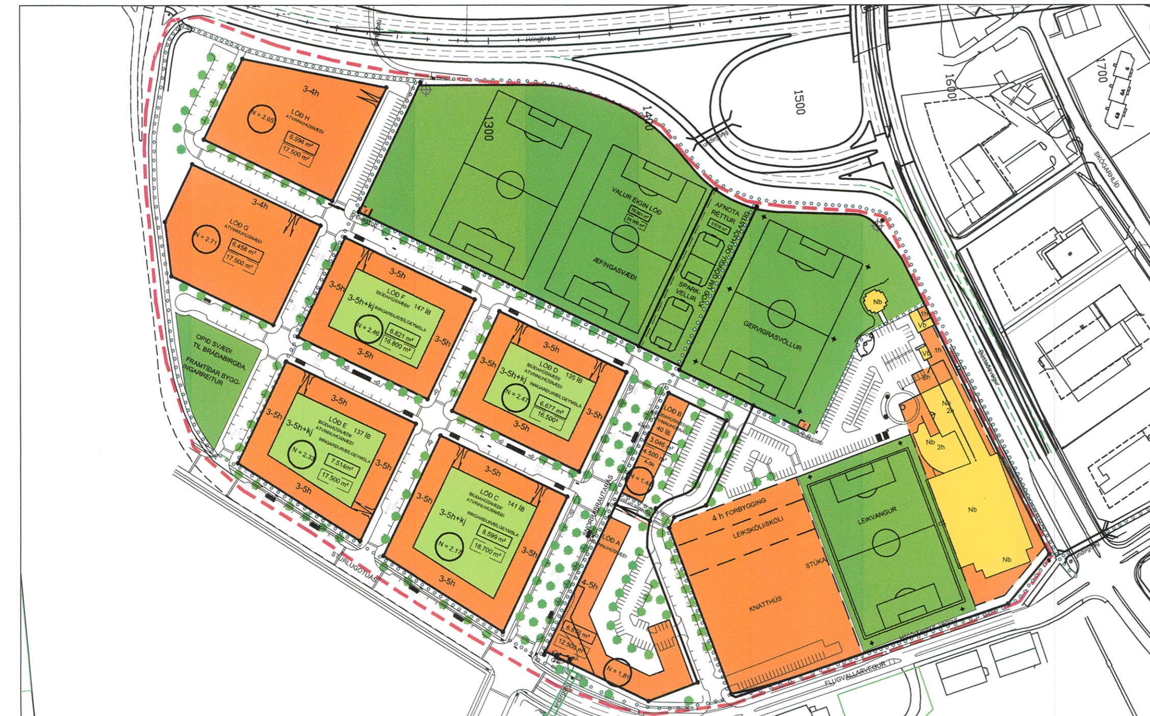
GILDANDI DEILISKIPULAG DAGS 2015.01.10 1:2500