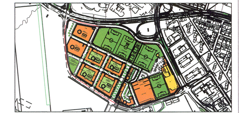
HLÍÐARENDI DEILISKIPULAG 2015

Deiliskipulagsbreyting þessi, sem fengið hefur meðferð í samræmi við ákvæði 2.mgr.43.gr. skipulagslaga nr.128/2010 var samþykkt í Upphæfing og skilpáttgerð þann 15. júní 2016.