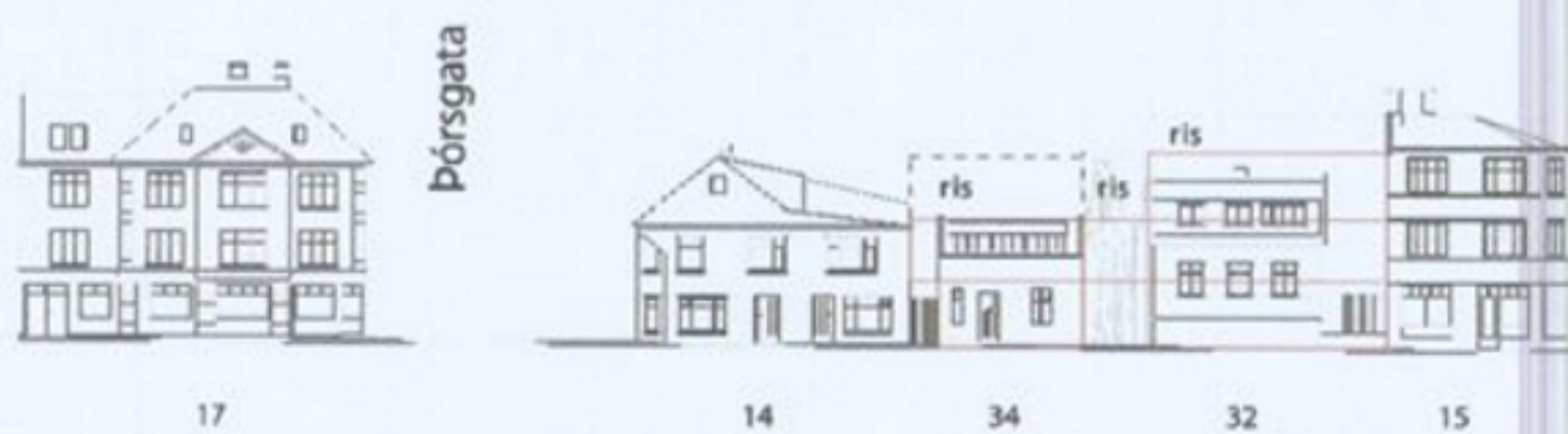
Götumynd Baldursgötu, gildandi deiliskipulag 1:500