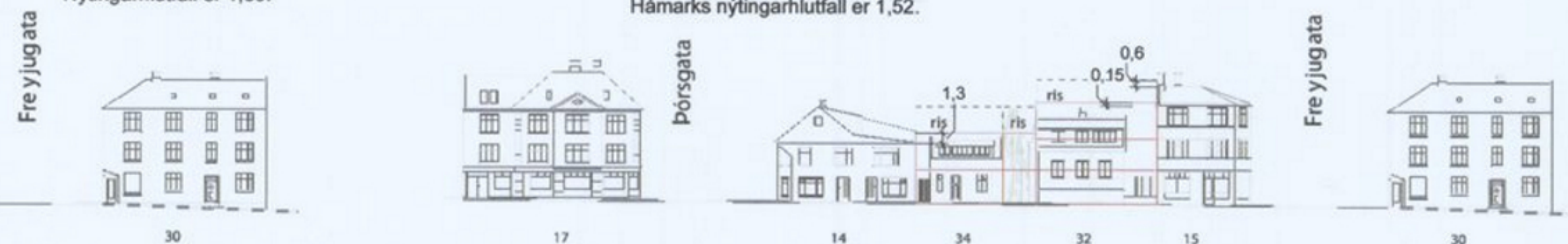
Götumynd Baldursgötu, tillaga að breyttu deiliskipulagi 1:500