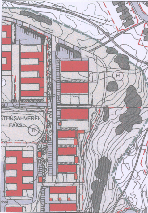
Hluti af gildandi deiliskipulagi samþykktu í borgarráði 22. september 2005 með síðari breytingum - Mkv. 1:1000