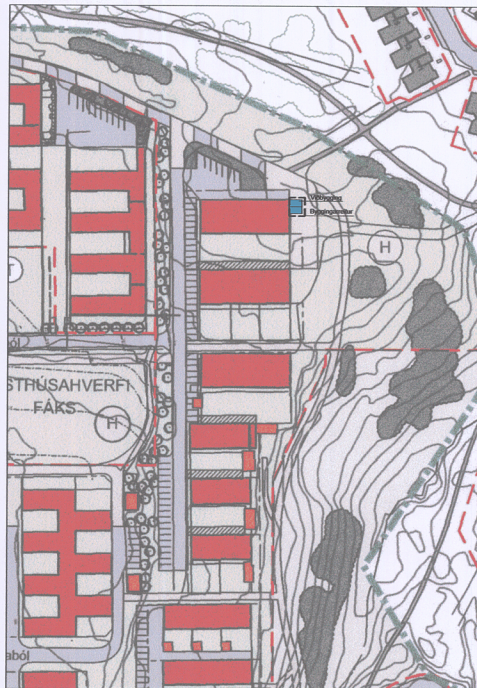
Tillaga að breytingu á deiliskipulagi - Mkv. 1:1000