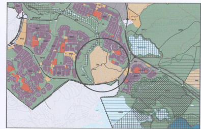
Hluti aðalokulagis Reykjavíkur 2010-2030 - Þéttbýlisskipulag. Uppfært 6. febrúar 2014.