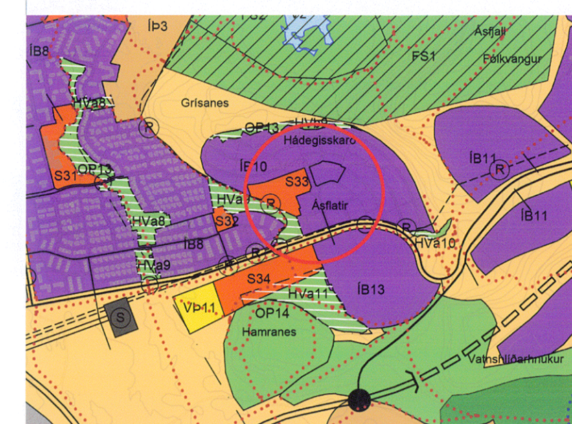
HLUTI AÐALSKIPULAGS HAFNARFJARÐAR 2013-2025 STAÐSETNING SVÆÐISINS