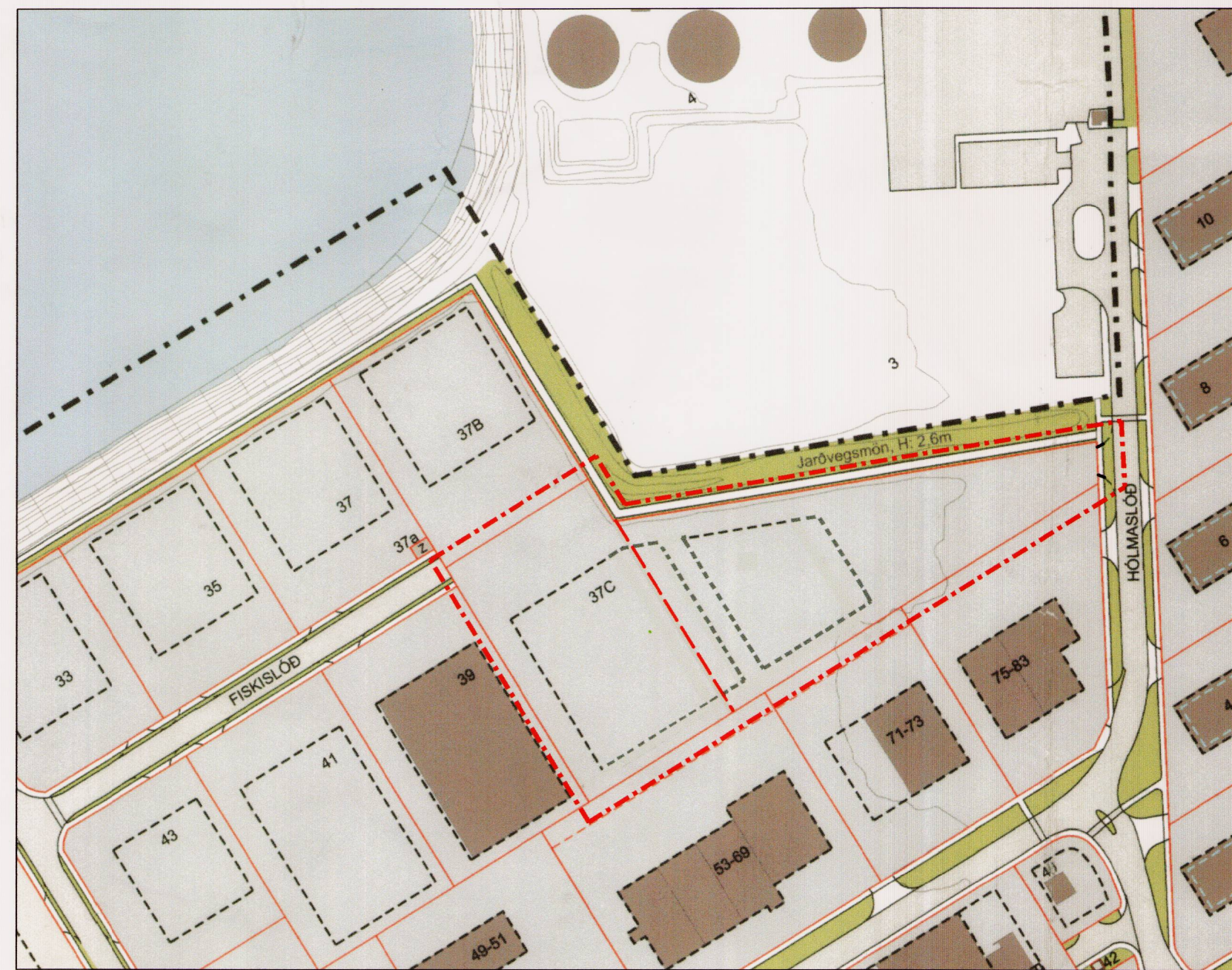
Tillaga að deiliskipulagsbreytingu mkv. 1:2000