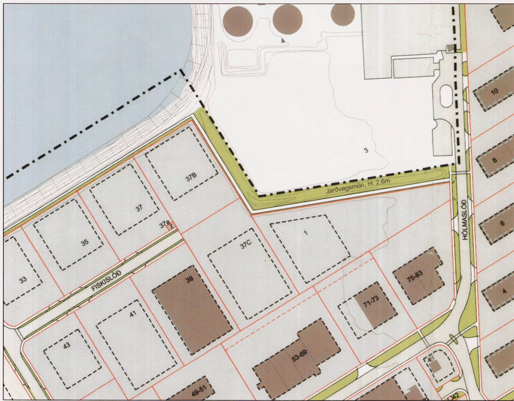
Hluti gildandi deiliskipulags samþykkt í borgarstjórn 3.nóv.2015 með síðari breytingum. 1:2000