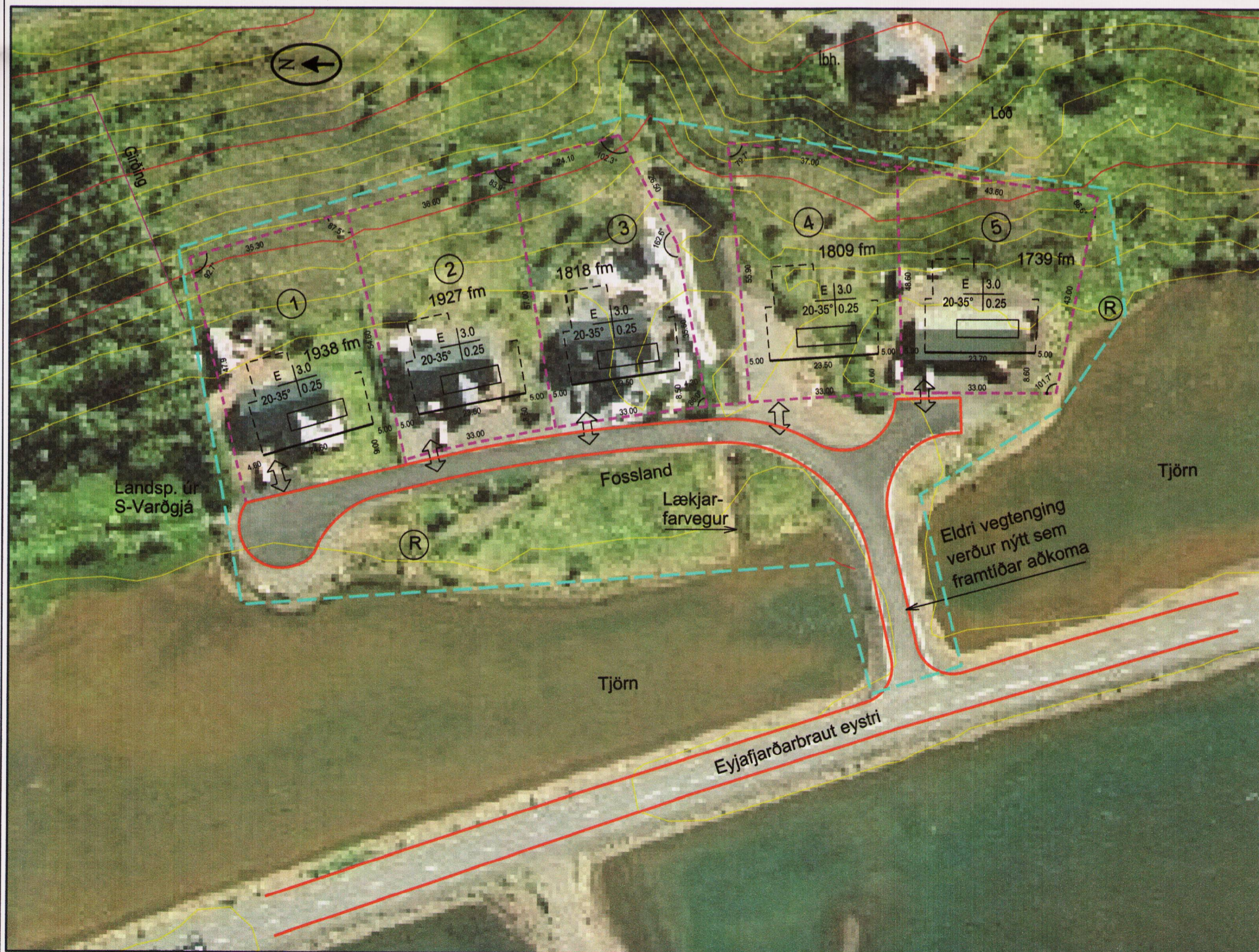
Tillaga að breytingu mkv. 1:1000