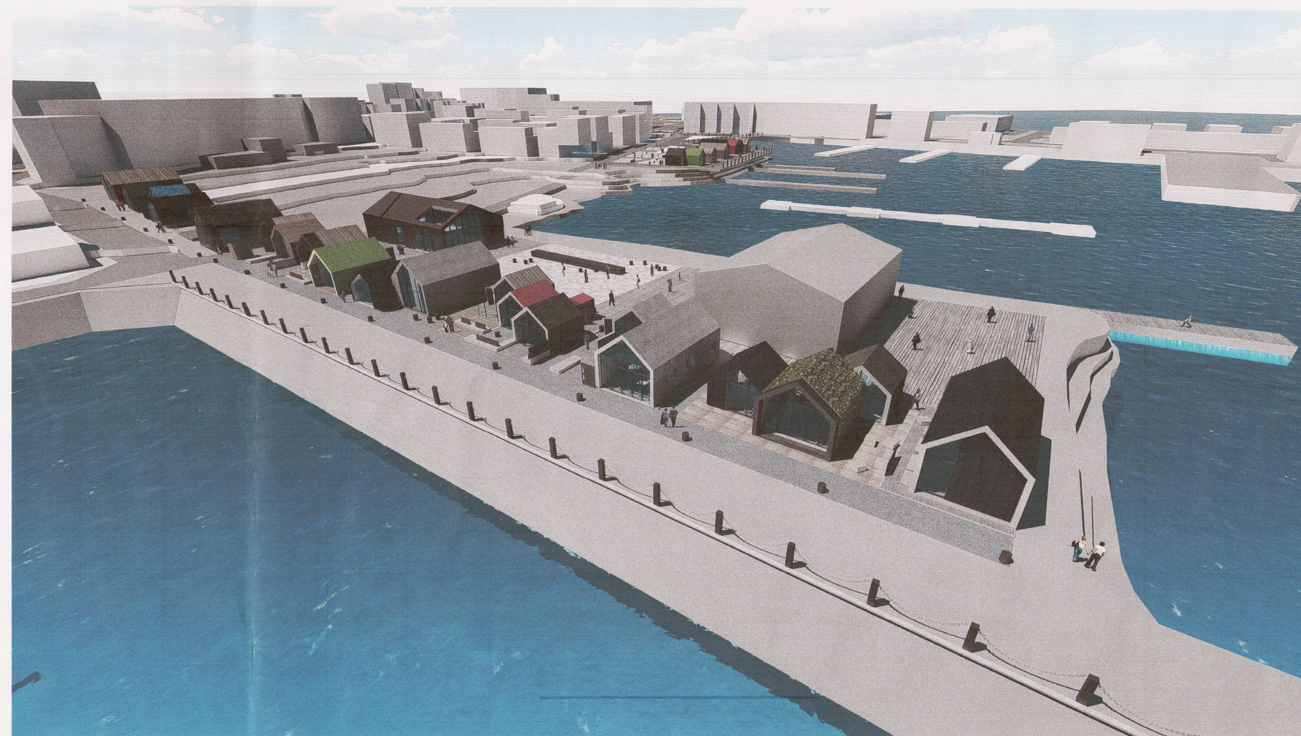
REITUR 06 - HORFT YFIR HAFNARSVÆÐI MEÐ VESTURBUGT (REITUR 05) Í BAKGRUNNI