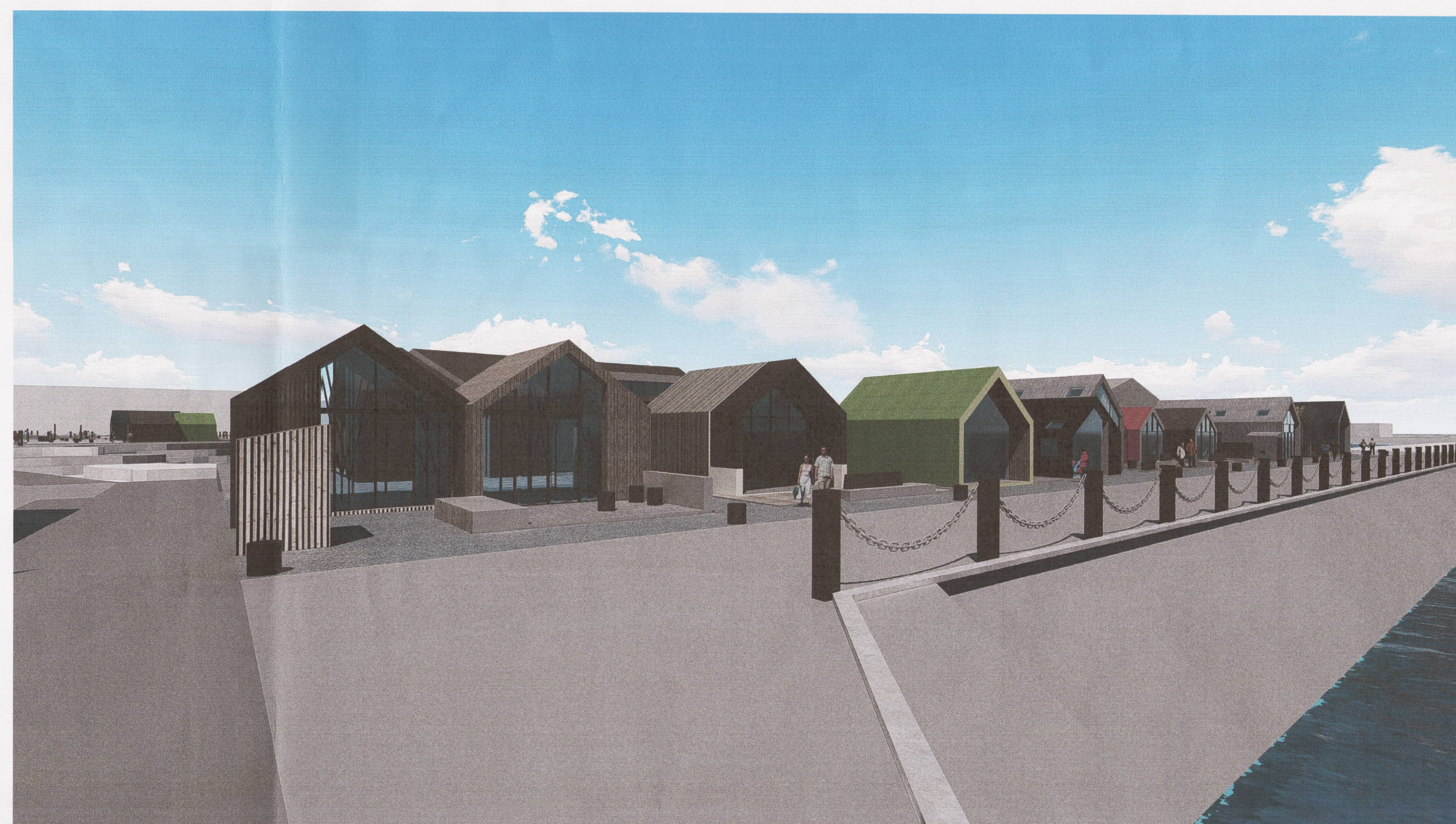
REITUR 06 - HORFT EFTIR GÖNGULINU