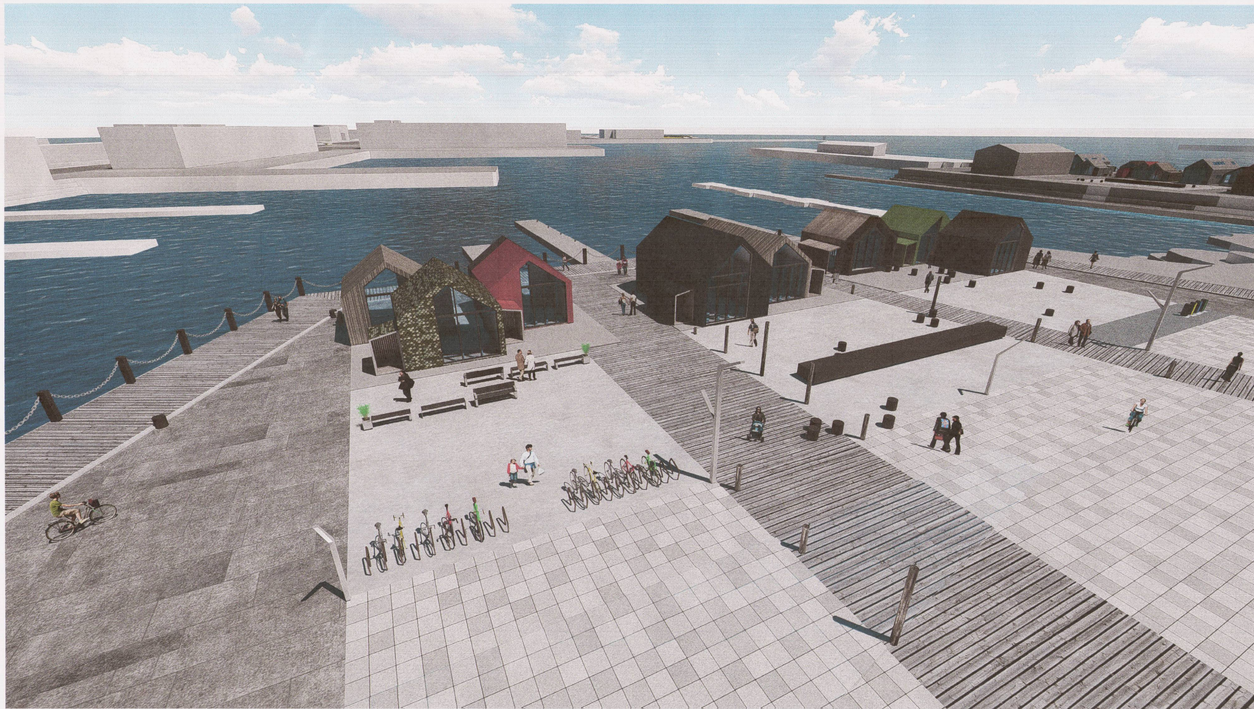
REITUR 05 - HORFT YFIR TORG