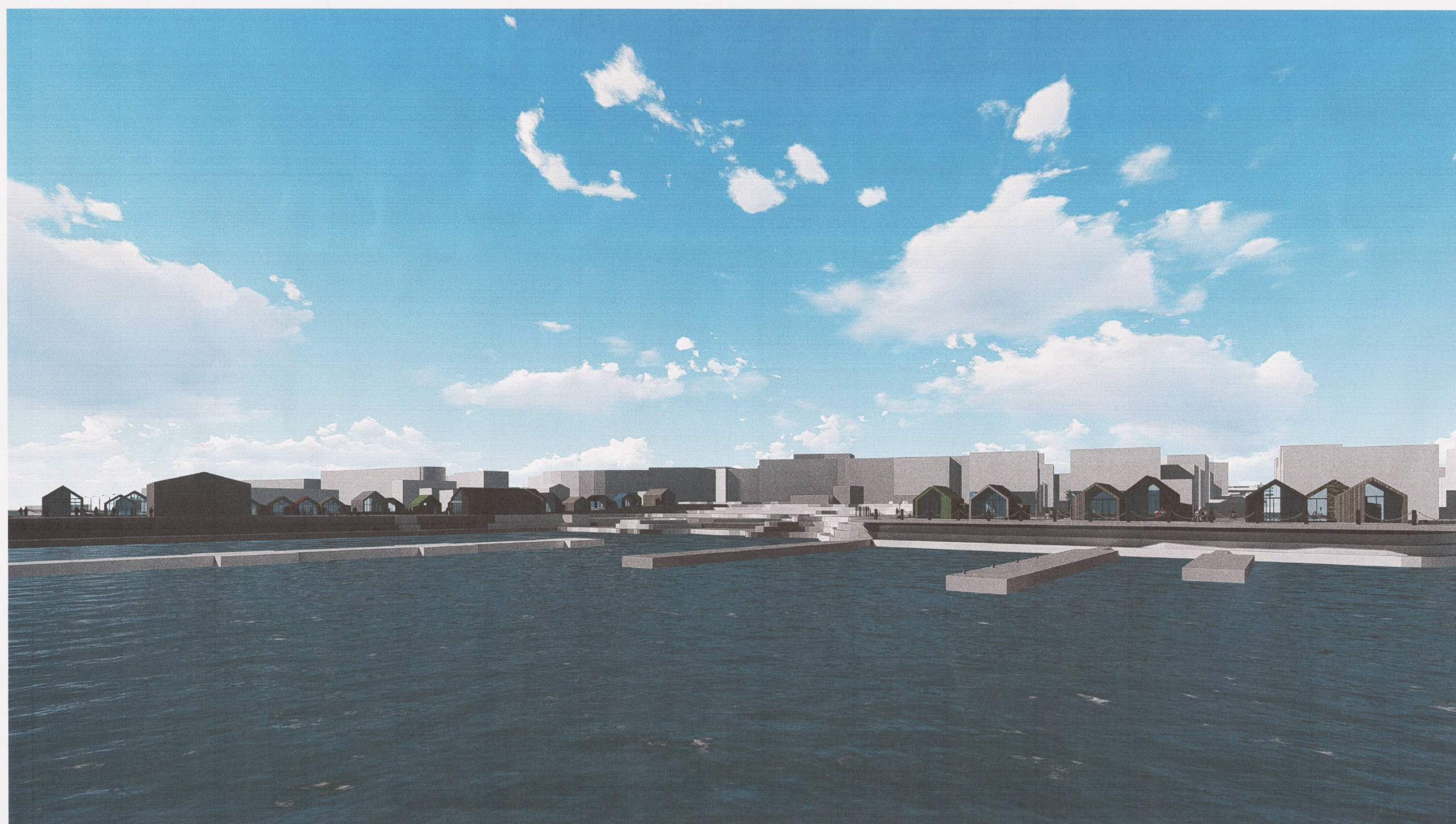
REITUR 05 - HORFT YFIR HAFNARSVÆÐI Í ÁTT AÐ BYGGÐ