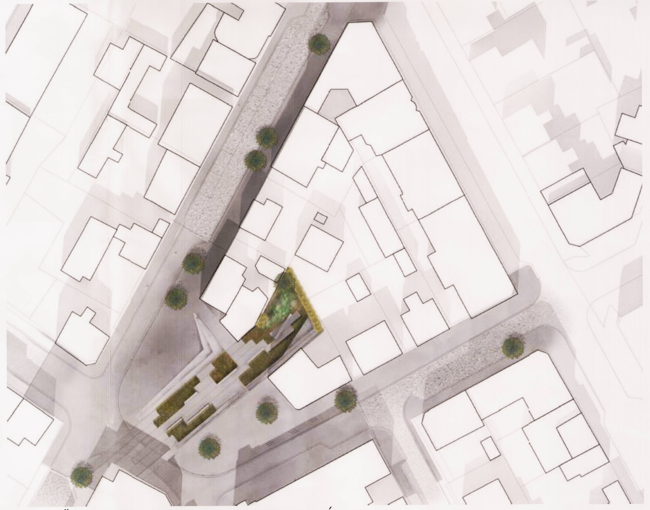
FRUMHÖNNUN TORG. GRUNNMYND (EKKI Í KVARÐA).

Nánari skilmálar, markmið og forsendur deiliskipulagsins koma fram í heftinu "Miðborgarsvæði Reykjavíkur. Greinagerð og deiliskipulagskilmálar fyrir staðgreinireit 1.181.0." SAMPYKKTIR: Deiliskipulagsbreyting þessi sem fengið hefur meðlög í samræmi við ákvæði 1. mgr. 43. gr. skipulagslaga nr. 123/2010 var samþykkt í Umhverfis- og skipulagsráði þann 6. júní 2018 og í Borgarráði þann 13. júní 2018 . Tillagan var auglýst frá 28. mars 2018 með athugasemdarfræsi til 6. mænu 2018 . Auglýsing um gildistöku breytinganna var birt í B-deild Stjórnartíðinda þann 20 2018 . Björn Arnarson