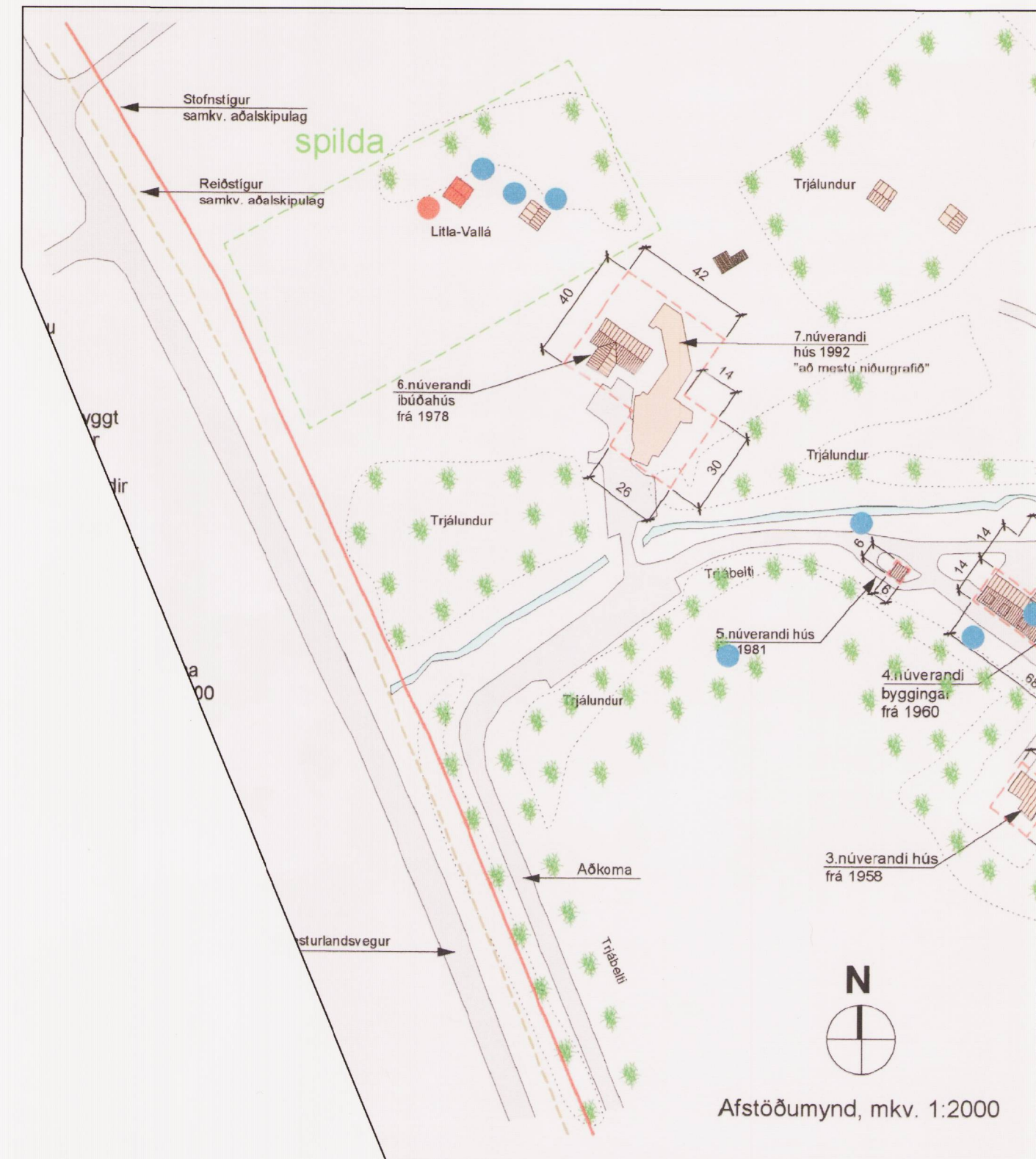
Afstöðumynd úr gildandi deiliskipulag Vallár á Kjalarnesi