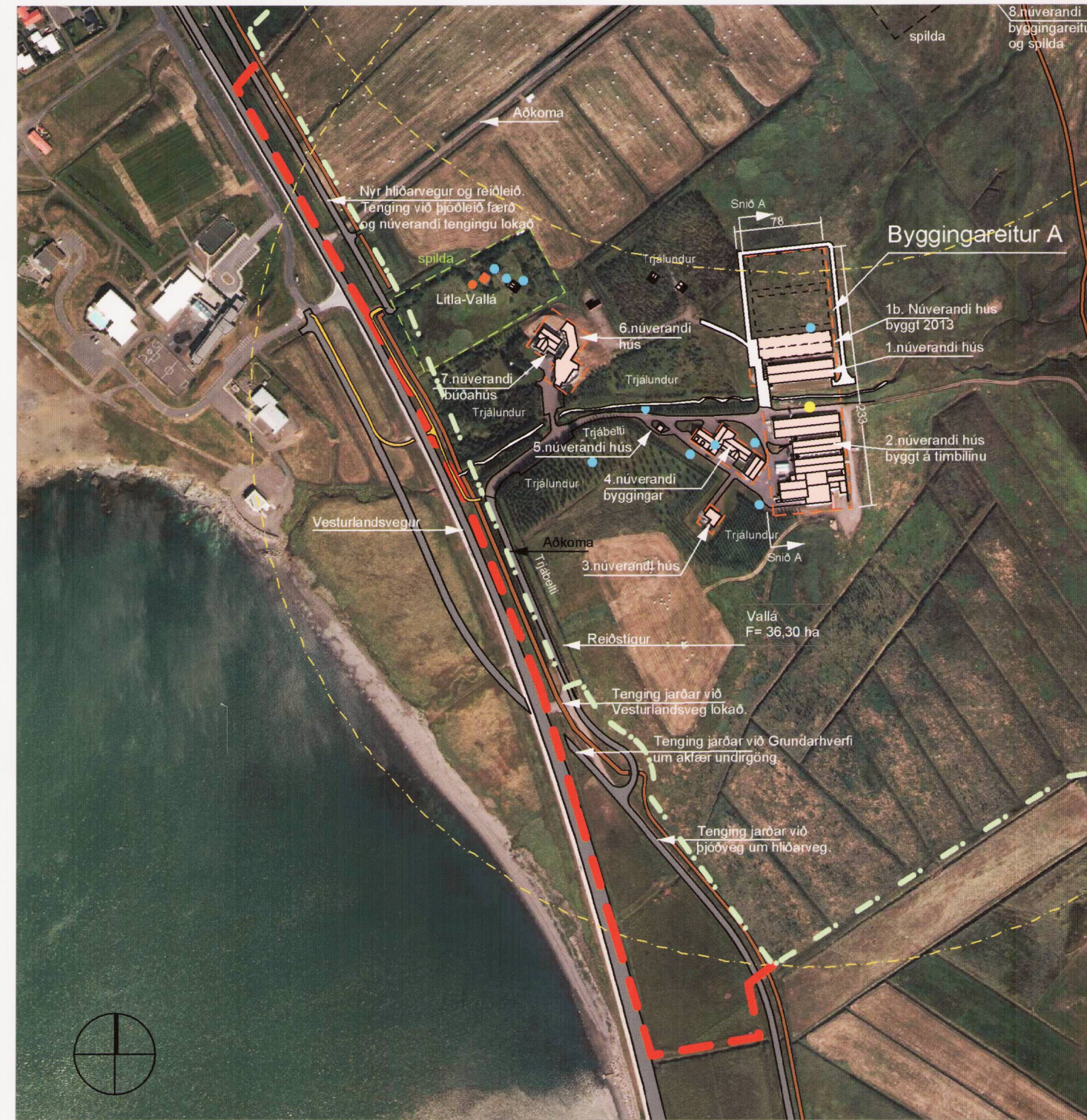
Tillaga að deiliskipulagsbreytingu