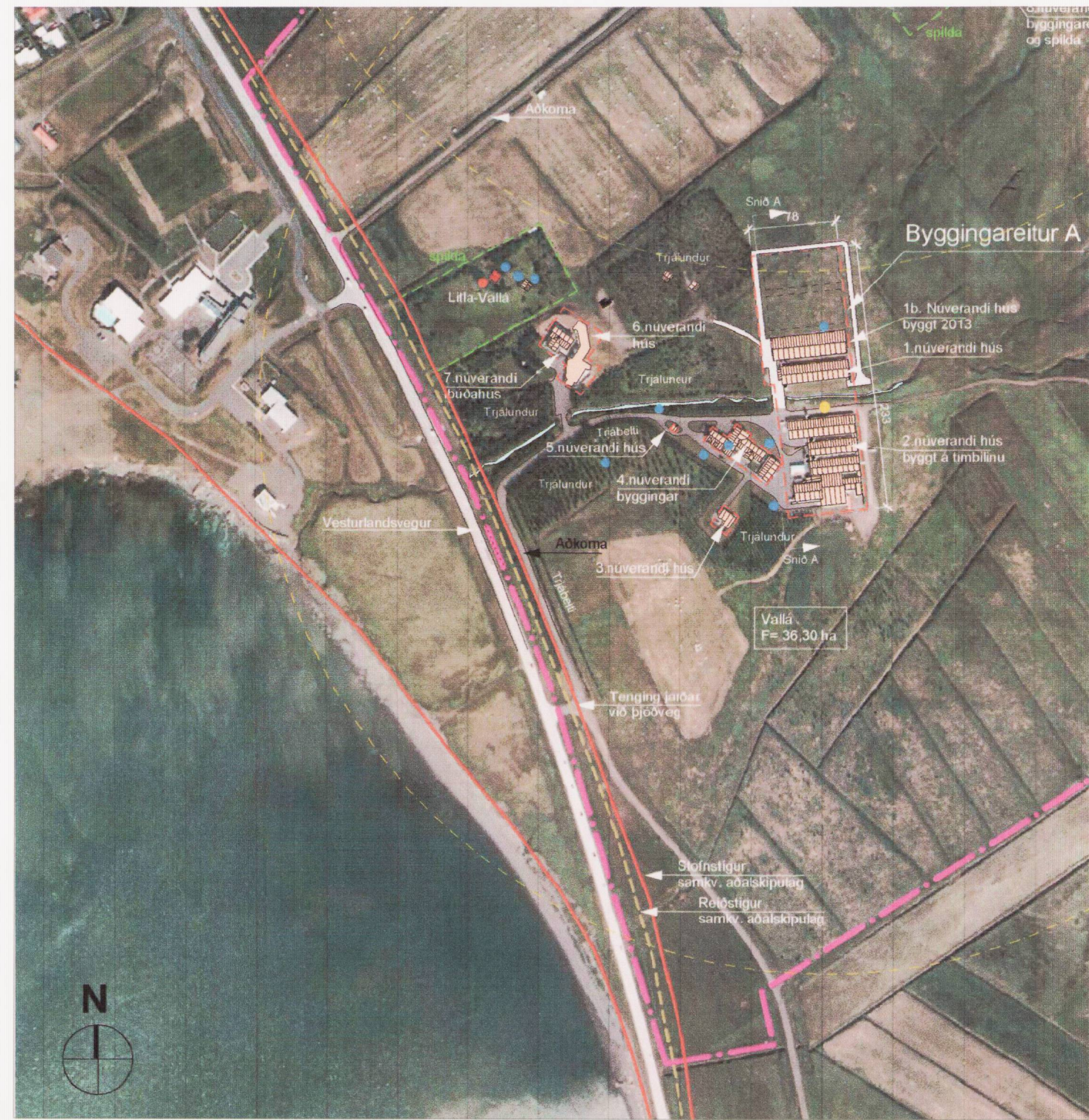
Hluti gildandi deiliskipulags Vallár á Kjalarnesi, staðfest í B-deild 15.04.2015 og breytt 07.04.2017.