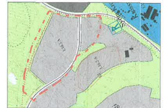
Aðalskipulag Akureyrar 2005 - 2018 - mkv. 1:10.000

Deiliskipulagstillaga þessi sem auglýst hefur verið samkvæmt 1. mgr. 25. gr. skipulags- og byggingarlaga nr. 73/1997, frá 2008. Athugasemdafrestur var til 2009. var samþykkt í Skipulagsnefnd Akureyrar þann 2009 og bæjarstjórn Akureyrar 2009.