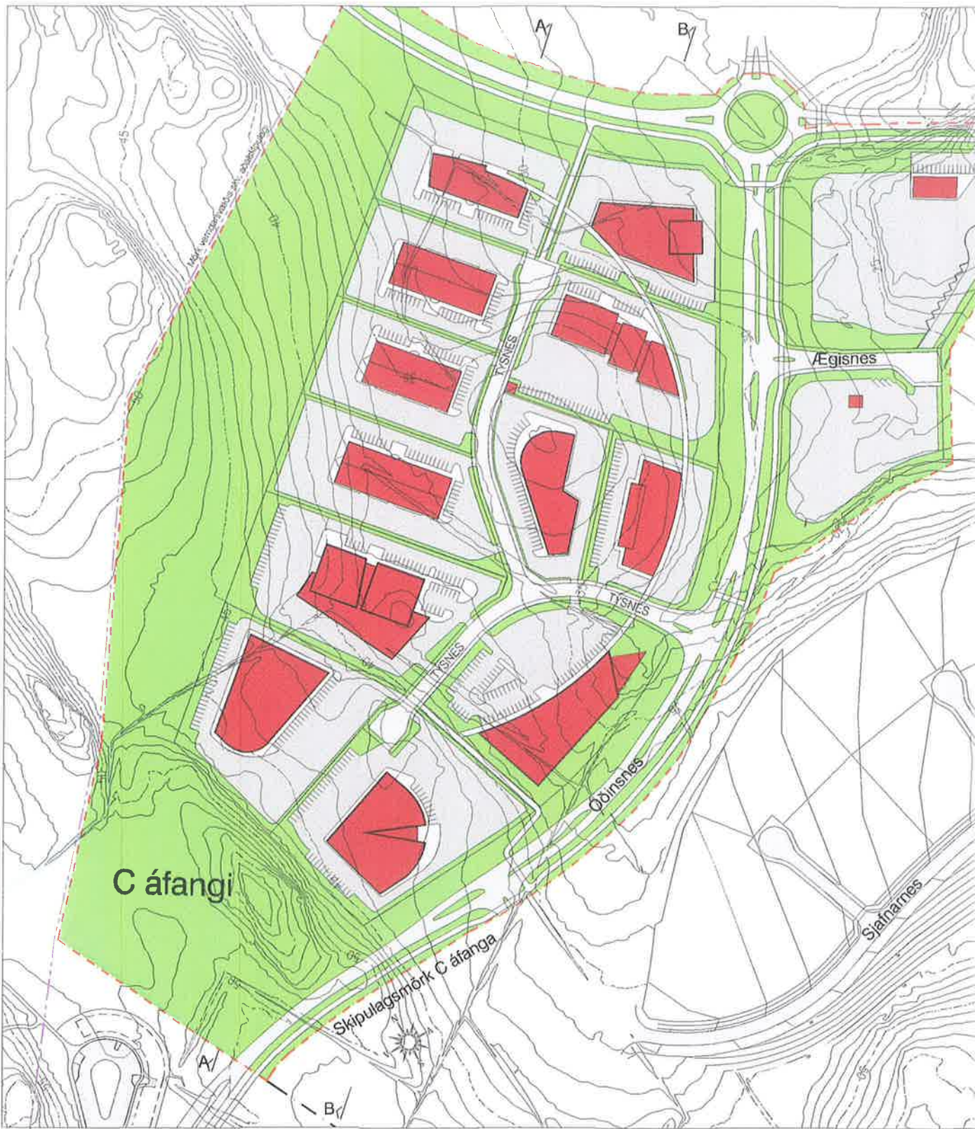
SKYRINGARMYND MED DEILISKIPULAGI - mkv. 1:2000