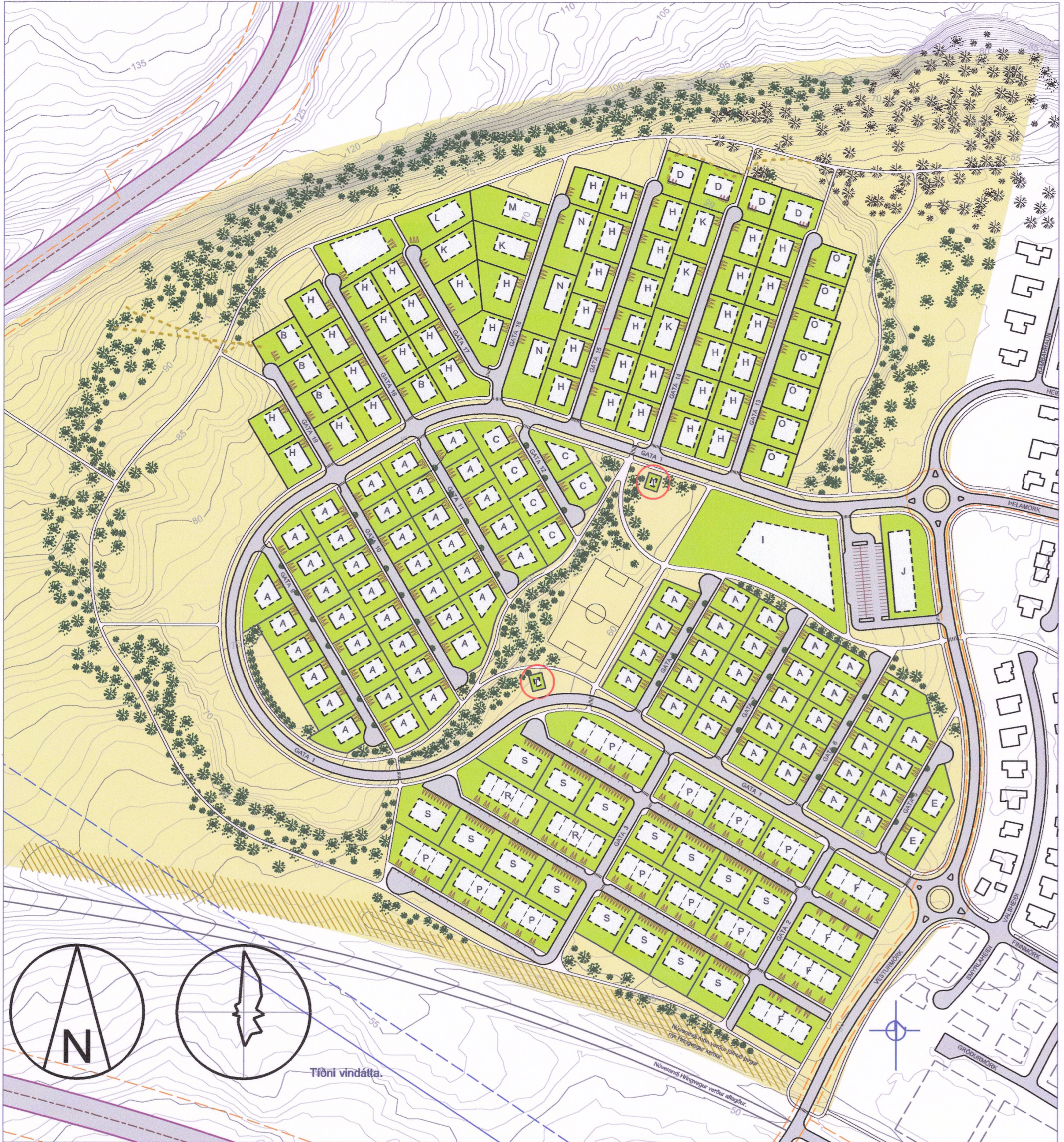
Kambaland í Hveragerði breyting á deiliskipulagi 1:2500