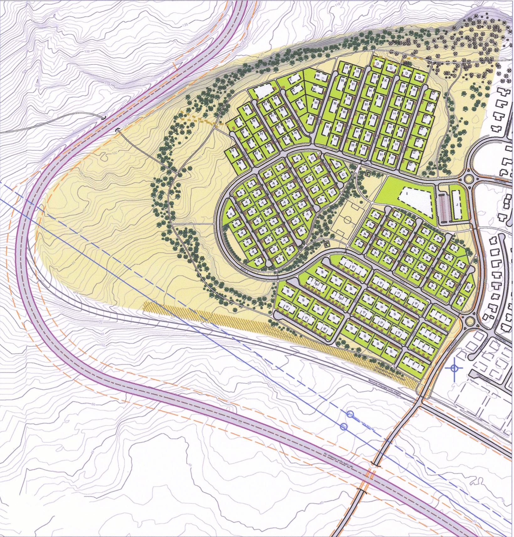
Kambaland í Hveragerði núverandi deiliskipulag 1:5000