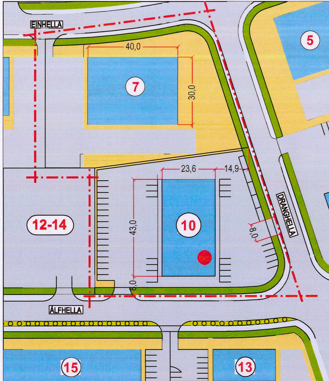
Hluti gildandi deiliskipulags, samþykkt dags. 19.júní 2019.