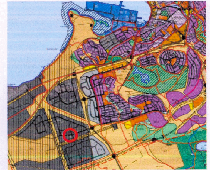
Hluti af aðalskipulagi Hafnarfjarðar. (2013-2025). SKÝRINGAR