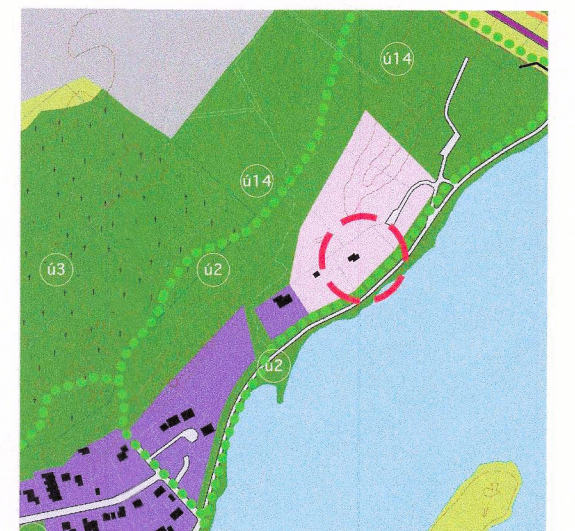
Úr Aðalskipulagi Árborgar 2010 - 2030

Uppdráttur þessi er teiknaður í hnitakerfinu ISN93 og byggir á uppréttri loftmynd frá Loftmyndum ehf.