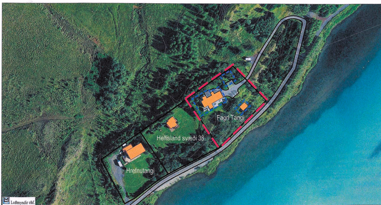
Yfirlitsmynd - ekki í kvarða