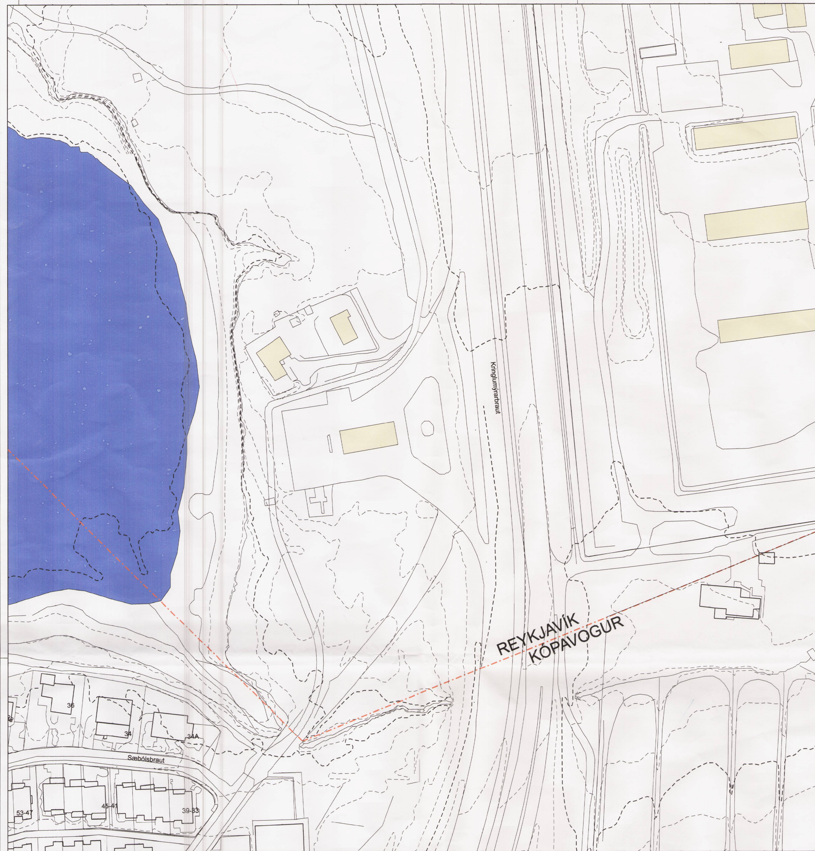
NÚVERANDI ÁSTAND 1:1000