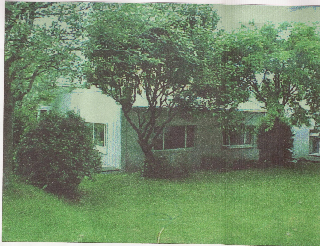
suð/austurhlíð - núverandi ástand - júní 2003

Breytingin er fölgín í því að stækka bílskúrinn um 25 m 2 og reka þar sjúkrahjálfunarstöð. Breytingin gerir ráð fyrir að stækkunin verði í sömu hæð og núverandi bygging er. Gert er ráð fyrir að þakkantar geti farið út fyrir byggingarreit. Áfram er gert ráð fyrir 3 bílastæðum á lóð.