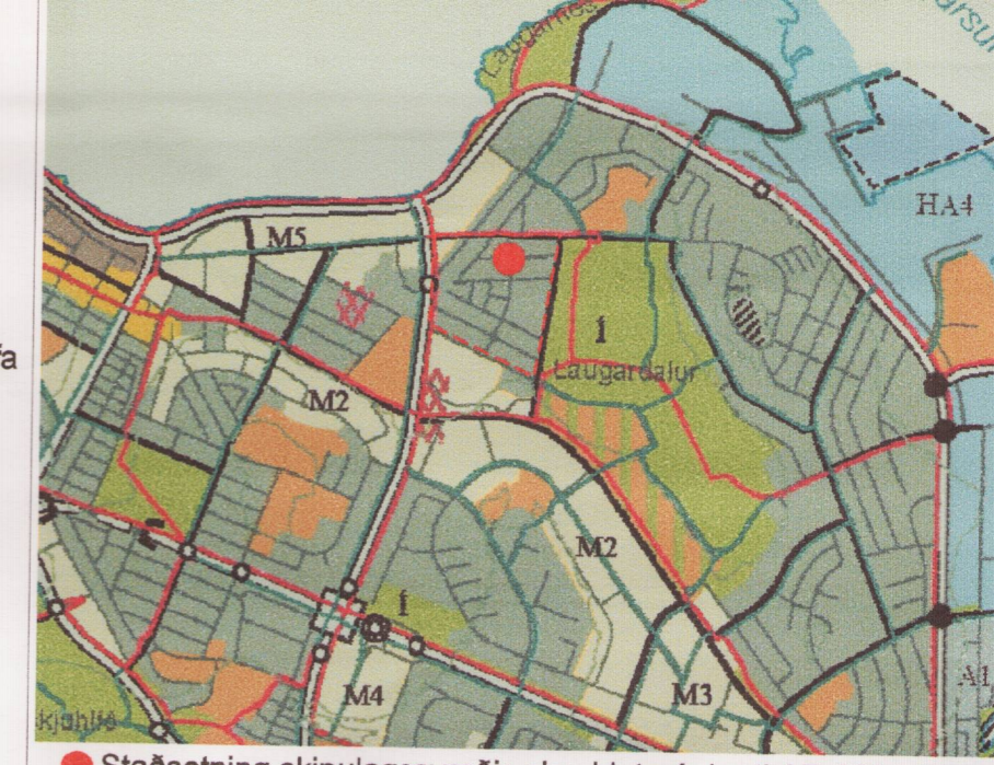
Staðsetning skipulagssvæðis skv. hluta úr korti AR 2001-2024

Breytingar: _____ _____ Útlínur húsa eru í samræmi við grunnkort úr LUKR, dags. 1999, með áorðnum breytingum. Lóðamarkalínur hafa ekki verið sannprófaðar, mæliblöð fyrir einstaka lóðir gilda. Kvaðir eru skv. gildandi mæliblöðum. Mál eru í metrum, nema annars sé getið. Ef misræmi eða málvillur finnast á teikningum ber að tilkynna það til arkitekts án tafar.