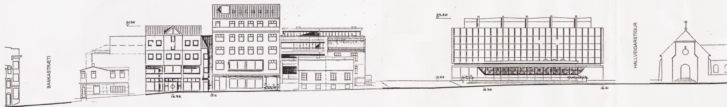
INGÓLFSSTRÆTI AÐ AUSTAN, FYRIR BREYTINGU mkv.1:500