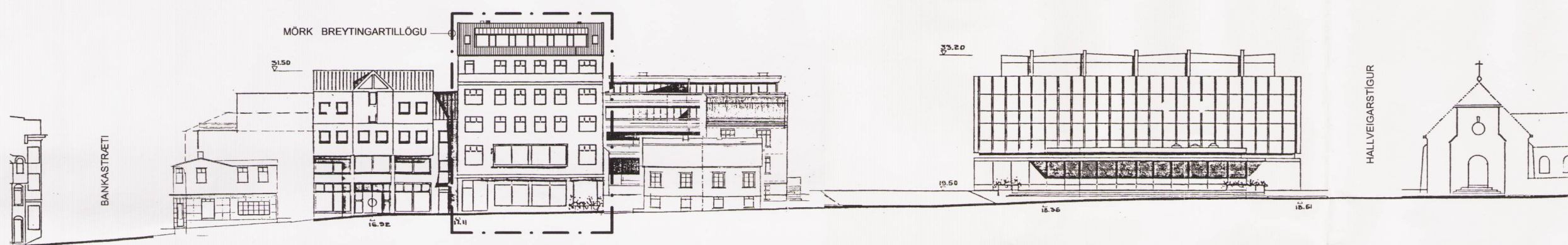
INGÓLFSSTRÆTI AÐ AUSTAN, EFTIR BREYTINGU mkv.1:500