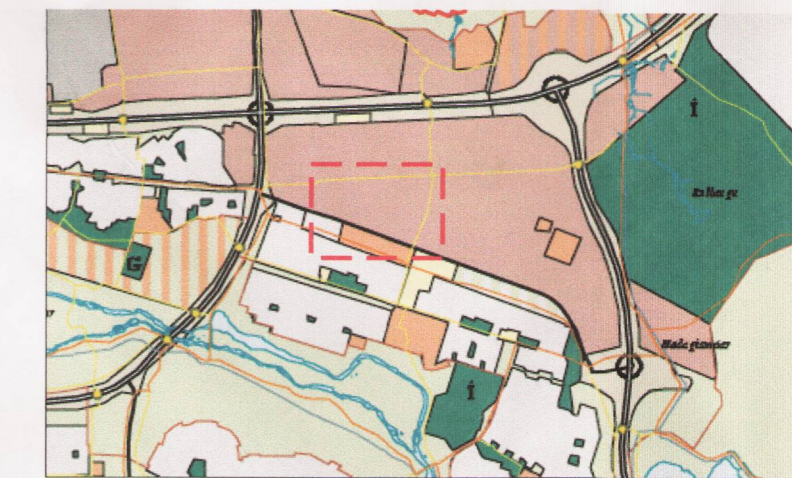
HLUTI AF AÐALSKIPULAGI REYKJAVÍKUR 1996-2016

Áorðnar breytingar eru: ný innkeysla útrá Bæjarhálsinum og sameining lóðanna þriggja nr. 1, 3 og 4 og heitir sameinuð lóð nú Bæjarháls 1.