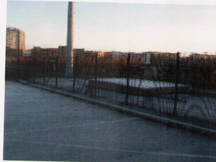
Steinsteypt tengihús gervigrasvallar

Undirritaður f.h.lóðarhafa Frostaskjól 4 er samþykktur þeim breytingum sem fram koma á deiliskipulagstillögu þessari, dags. 14.12.2012. Knaflspyrnufélag Reykjavíkur Kl. 700169-3919