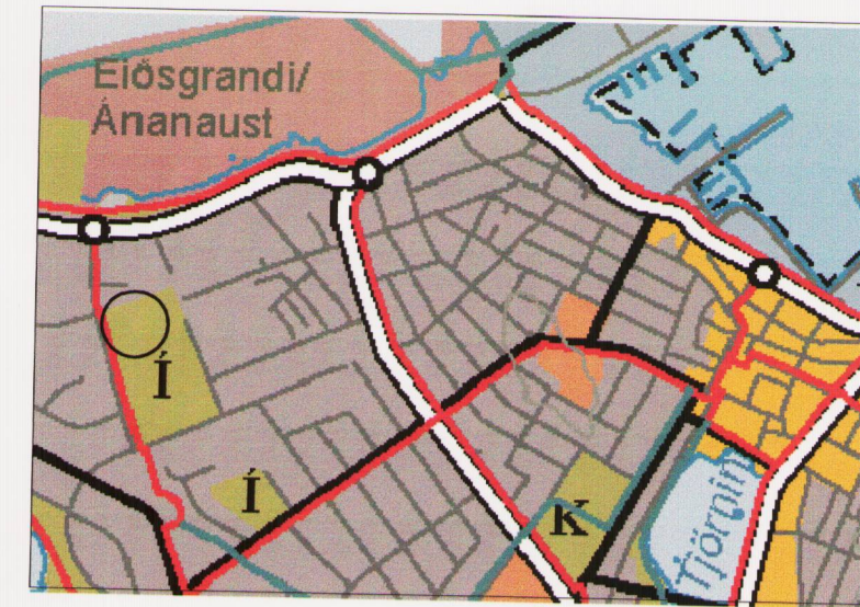
HLUTI ADALSKIPULAGS REYKJAVÍKUR 2001-2024