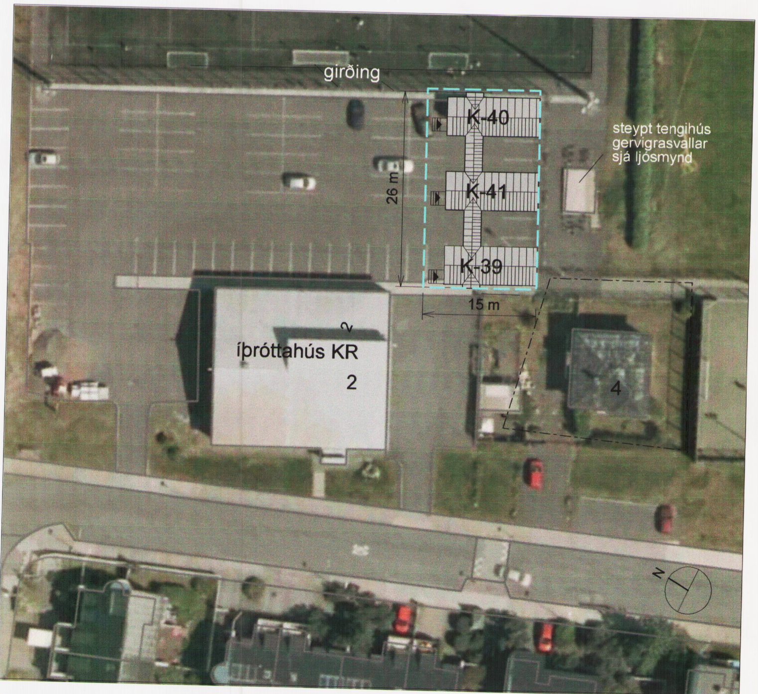
Skýringarmynd: loftmynd af fyrirhugaðri staðsetningu færanlegra stofa mkv.1:500