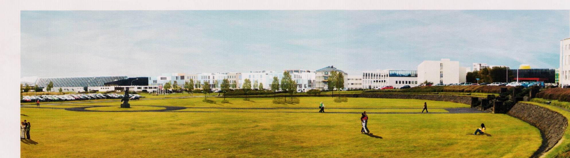
Frá aðalbyggðingun Háskóla Íslands