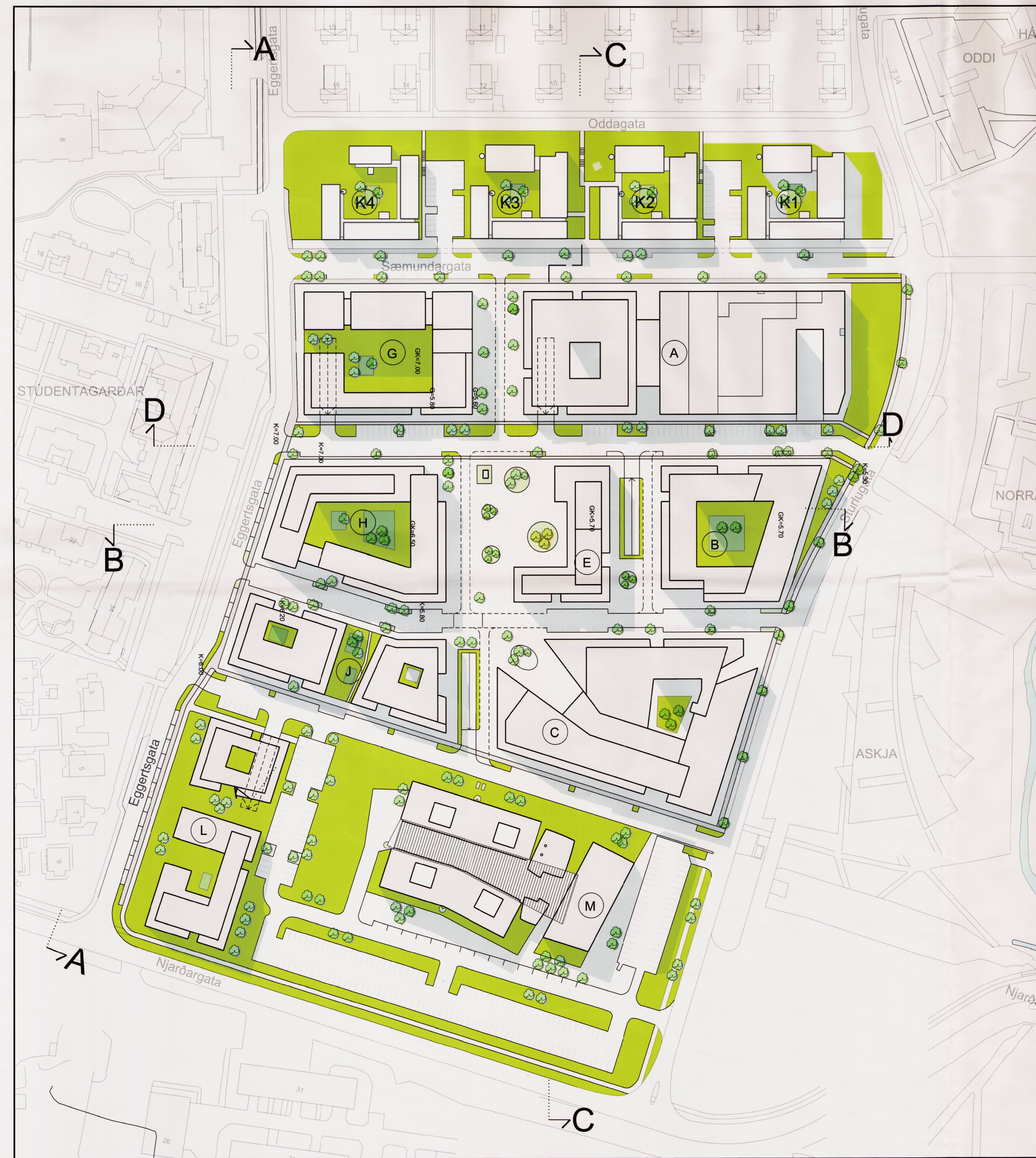
Deiliskipulagstillaga Sturlugótu 2, Vísindagarðar Háskóla Íslands, Reykjavík áður Deiliskipulag Sturlugótu 2, Reykjavík. Mkv. 1.1000

Breyting á deiliskipulögum: Háskóli Íslands, austurhluti Háskólalóðar, byggingarsvæði H, samþykkt í B-deild 14.9.2000 Deiliskipulag Sturlugótu 2, Reykjavík. Mkv. 1.2000. Samþykkt í borgarráði 9. júní 2011 Hverfismiðstöð Njarðargata, Eggertsgata 35, samþykkt í B-deild 24.9.2015