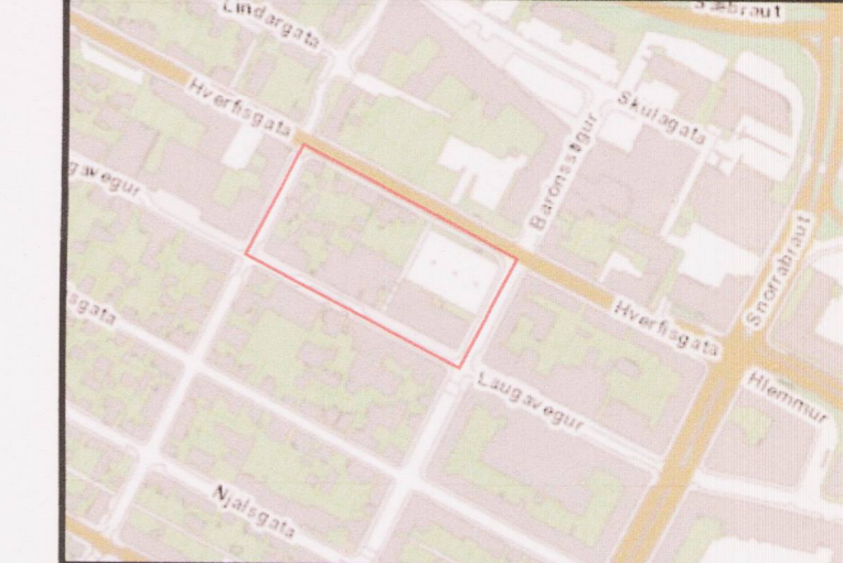
Staðsetning reits 1.174.0 1:5000